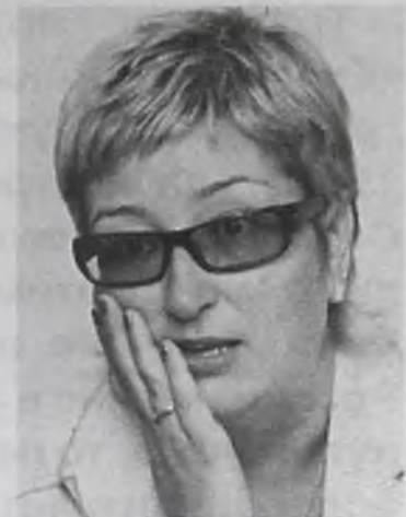
Писательница Татьяна Устинова на пресс-конференции в Ангарске 20 августа.

«Байкал – это целая Вселенная. Описать впечатления после поездки невозможно. Единственное, что поражает в самом сердце, – везде, где есть человек, – там помойка».