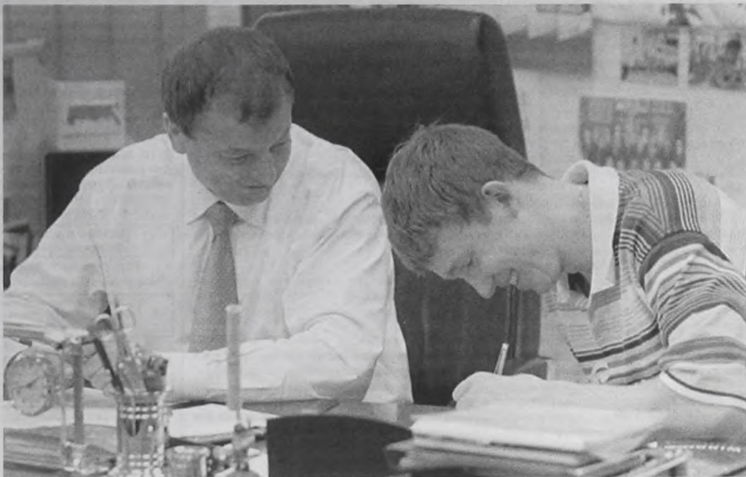
Оформляясь на работу, обратите внимание, спрашивает ли будущий шеф о страховом свидетельстве

– В кратчайшие сроки обратиться в отдел персучета Управления пенсионного фонда с паспортом и страховыми свидетельствами по адресу: Ангарск, 212 квартал, дом 15, время работы с 9-00 до 13-00 и 14-00 до 18-00, кроме субботы и воскресенья. Мы