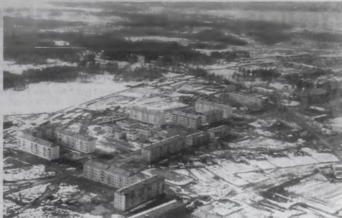
Из рабочего поселка городского типа Мегет превратился в крупный промышленный пригород с населением около 12 тысяч человек

В начале 30-х годов появилась необходимость в обеспечении радиосвязи Москвы с отдаленными районами Сибири и Дальнего Востока. Мегет идеально подходил для этих целей, и в 1936 году объект 9/1, или радиоцентр № 1, начали проектировать. Провели сюда железнодорожные пути, сделали дизельную электростанцию, передатчики монтировали на месте. Во время