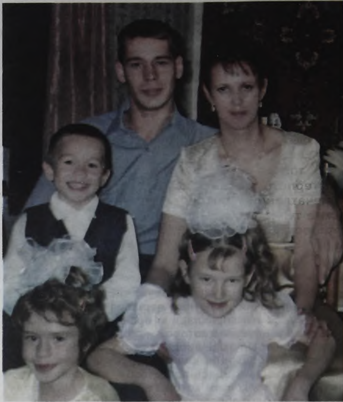
Все дети в этой семье талантливые. Иначе и быть не может. Когда вся семья собирается вместе, они плетут украшения из бисера, делают вязанные картины, лепят фигурки из глины или готовят.