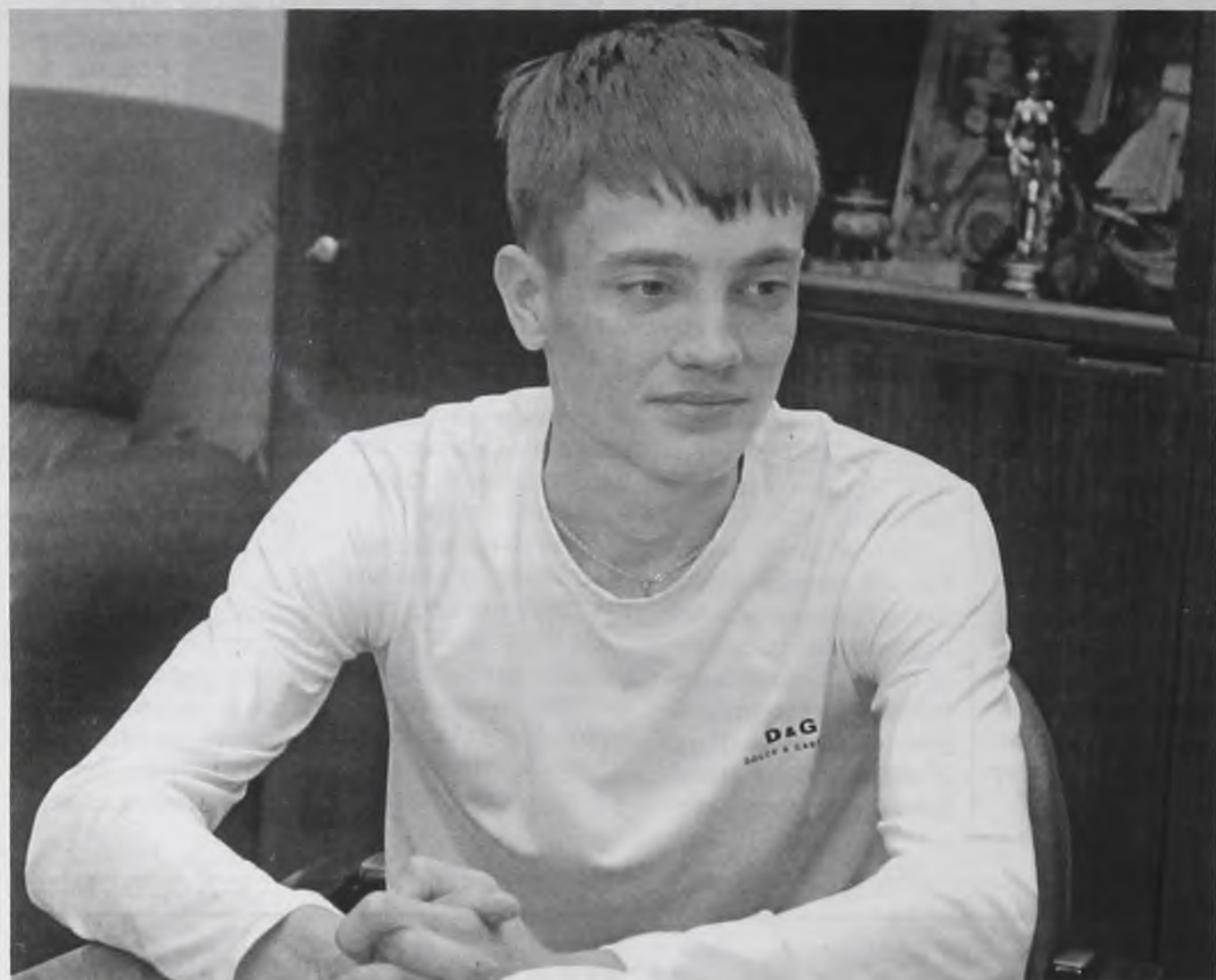
Победы – серьёзный шаг на пути к моей самой главной цели – Олимпиаде