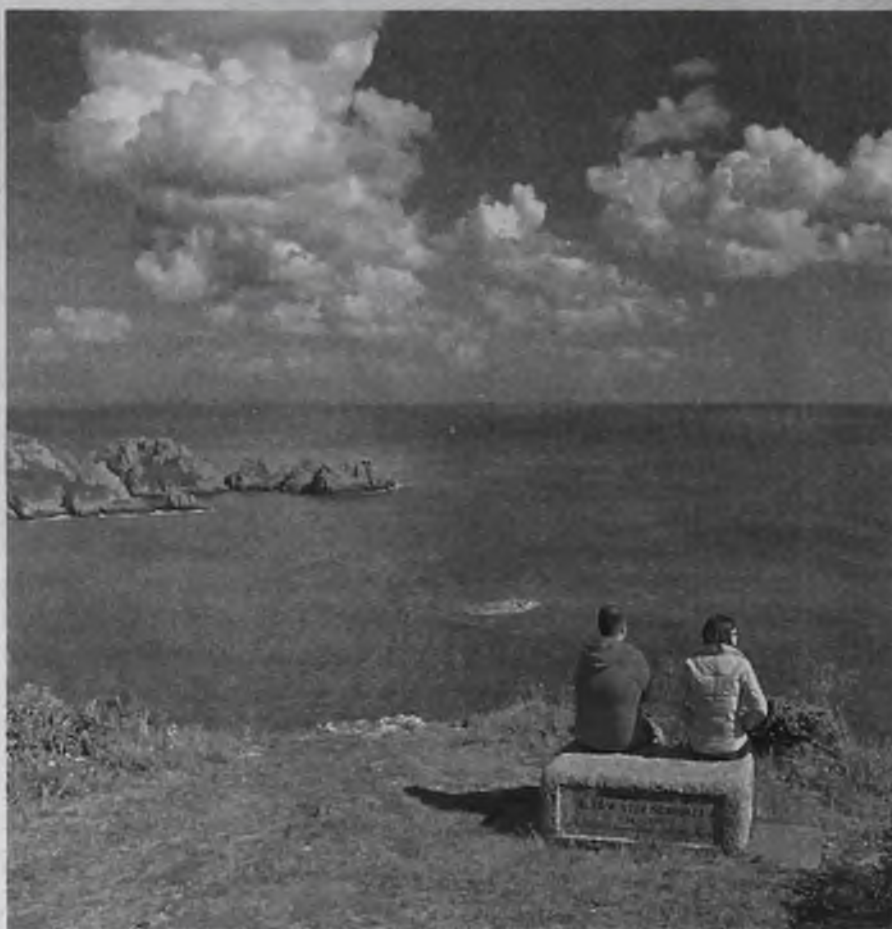
Мечтать лучше всего в красивом уединенном месте рядом с любимым человеком