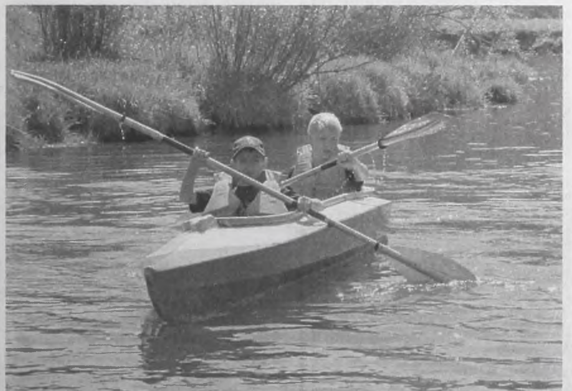
Прелесть этого спорта в том, что он воспитывает смелость, силу, выносливость и командный дух