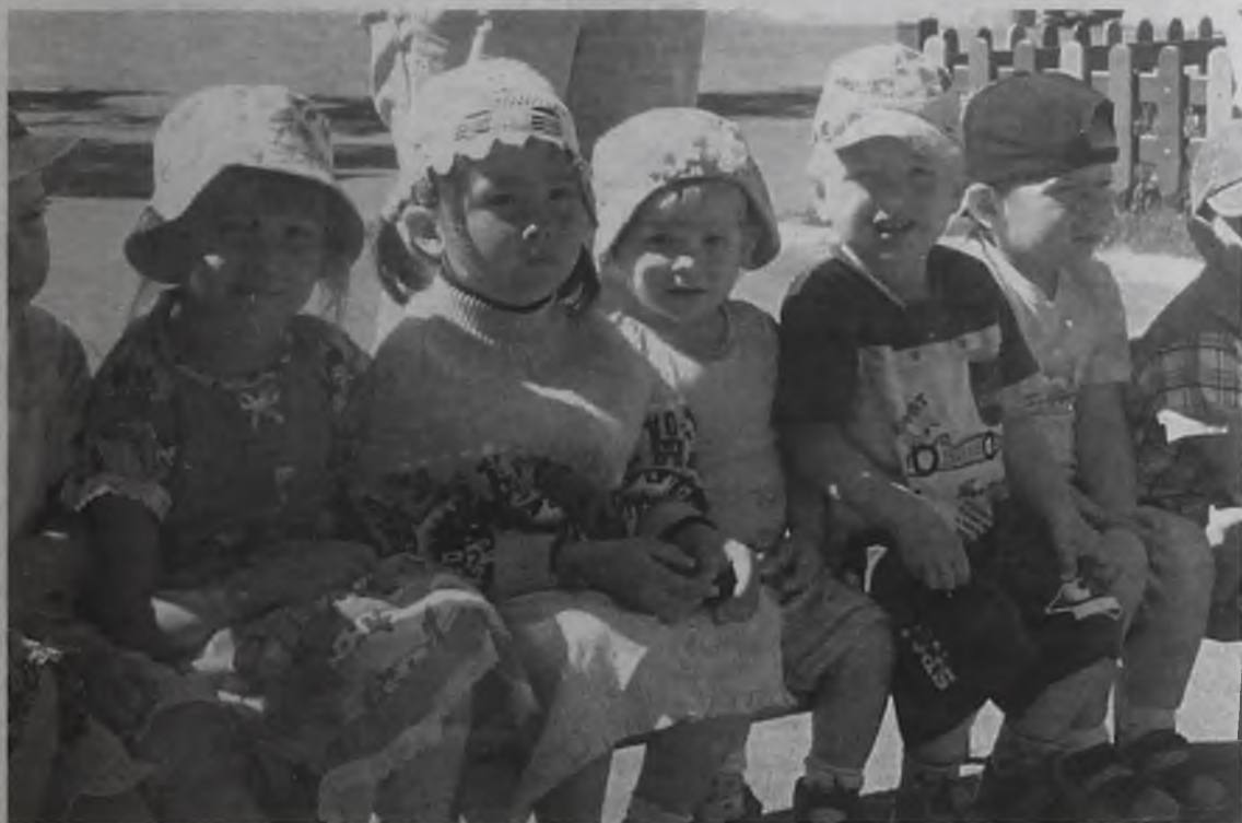
Когда смотришь на радостных мегетских ребятишек, понимаешь, что счастье есть, и оно рядом