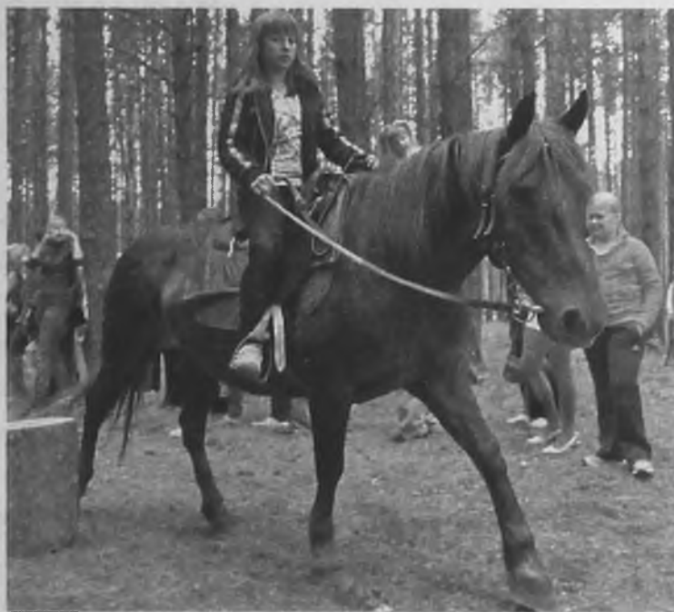
Иппотерапия – прекрасный способ оздоровления

Гвоздём программы в День открытых дверей стали соревнования по каякингу. Команды на время преодолевали на бай-