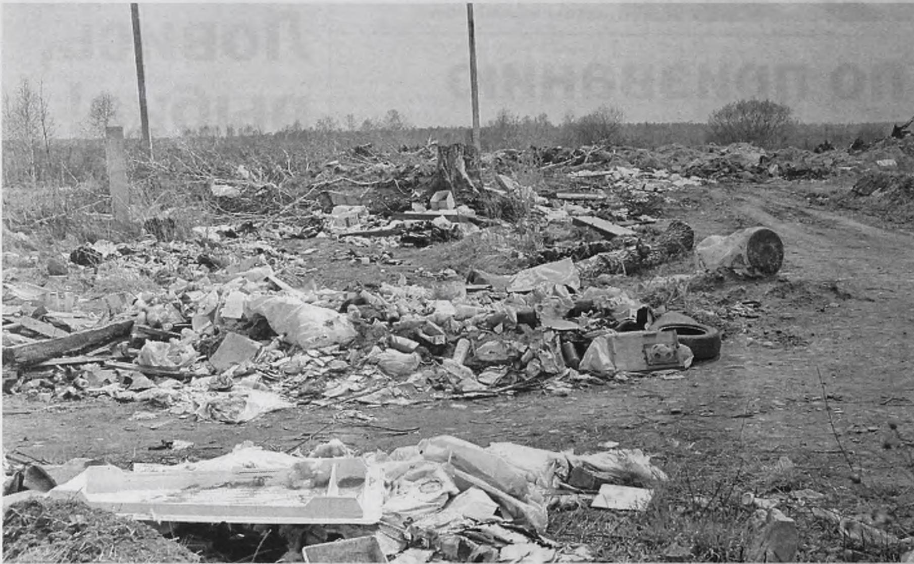
Нам надо защищаться не от свиного гриппа, а от мусорящих «свиней»