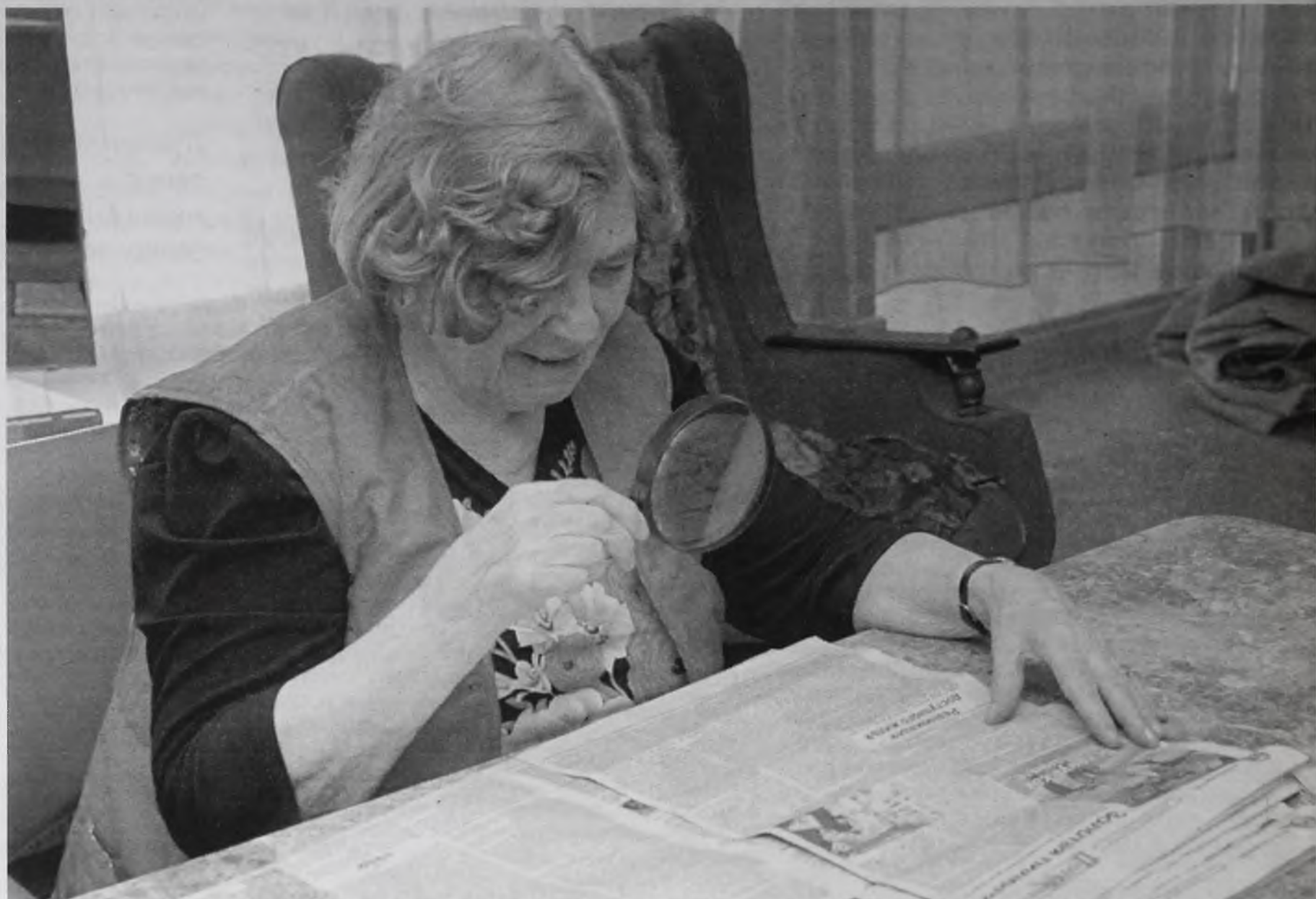
Смысл некоторых законов сквозь лупу не разглядишь. Но сотрудники интерната готовы биться за судьбу каждого подопечного

Человек, чью сторону сотрудники интерната решили отстаивать в суде,