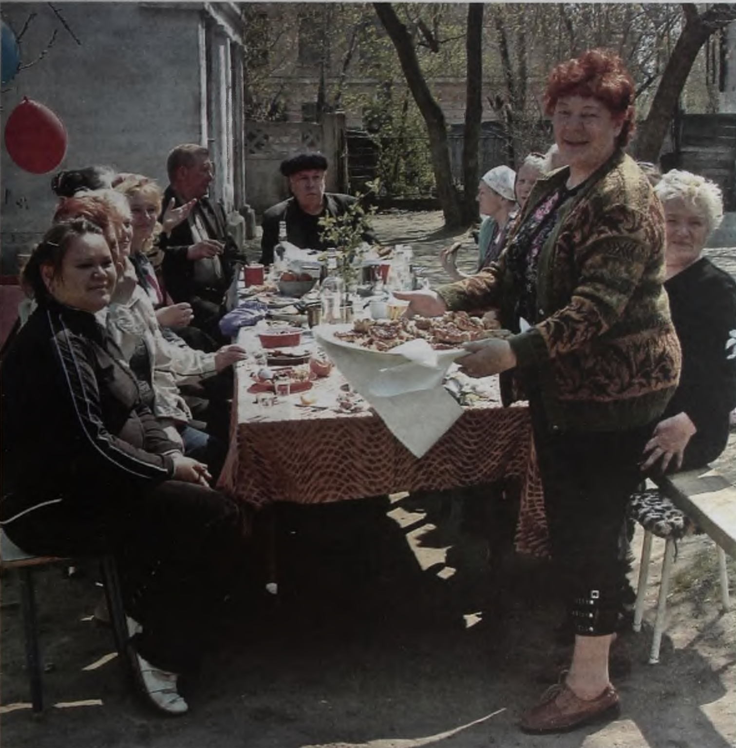
Советы общественности 120 квартала «Восточка» и «Восточка-1» организовали День соседей раньше своих коллег – 9 мая