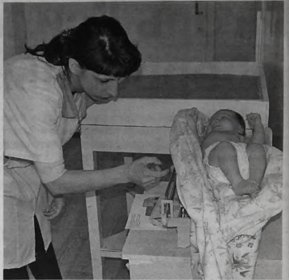
«Какой кризис – я же родился, такой красивый и счастливый!»