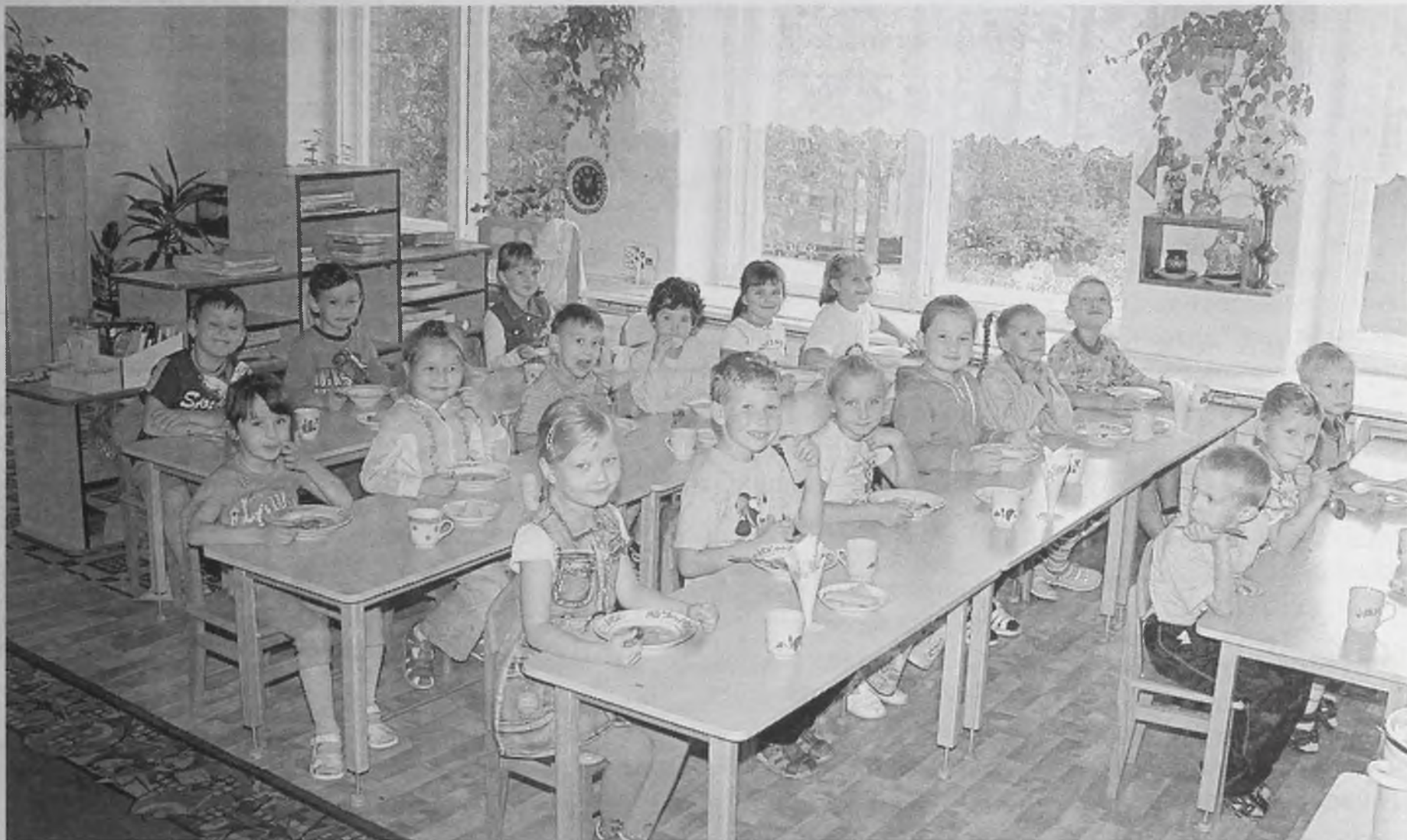
Обед в группе, пусть и праздничный, для детсадовцев-выпускников больше не интересен – им ресторан подавай. Такие времена, такие нравы.