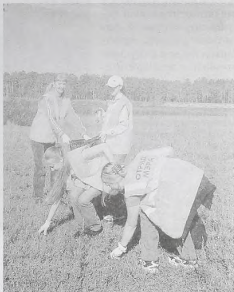
В прошлом году Отряды мэра побили рекорды популярности среди молодежи