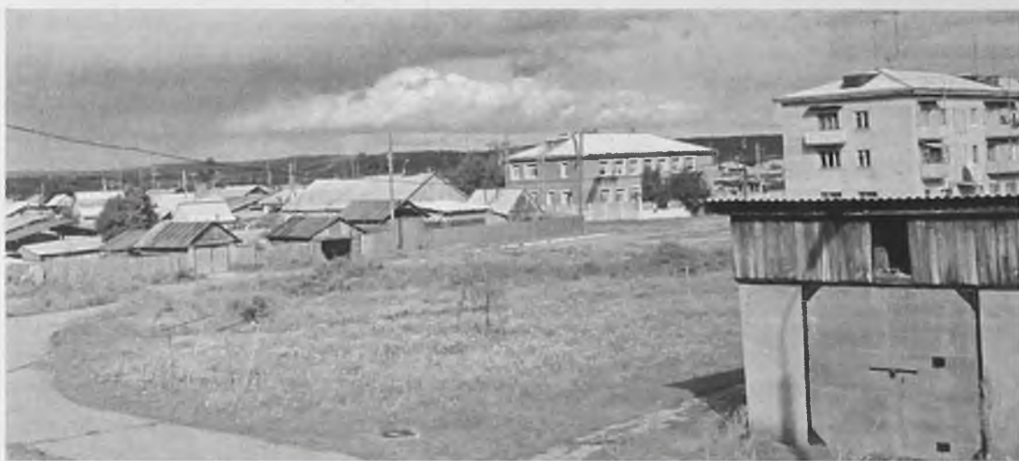
Савватеевка превратилась в край молчащих телефонов. Надолго?

В единую дежурно-диспетчерскую службу (ЕДДС) недавно поступило сообщение: Савватеевка осталась без стационарной телефонной связи. Отключили за долги.