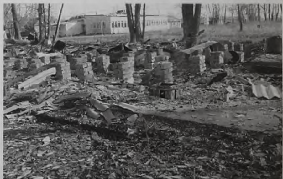
5 апреля около 5 часов утра клуб детского лагеря «Казачье войско» сгорел дотла. В том, что это был поджог, сомнений нет: в первом корпусе обнаружена канистра с бензином.