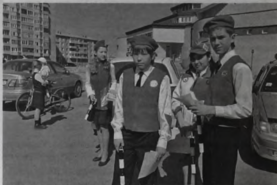
Юные инспекторы зачастую знают о правилах движения больше тех, кто имеет права