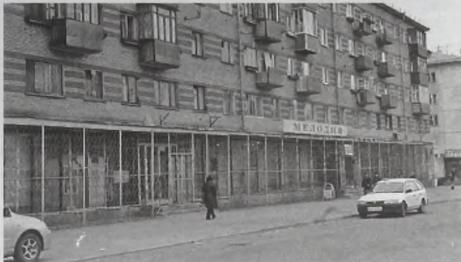
Ты – моя «Мелодия». Тому, кто хочет сказать так, надо выложить как минимум 24 млн. рублей