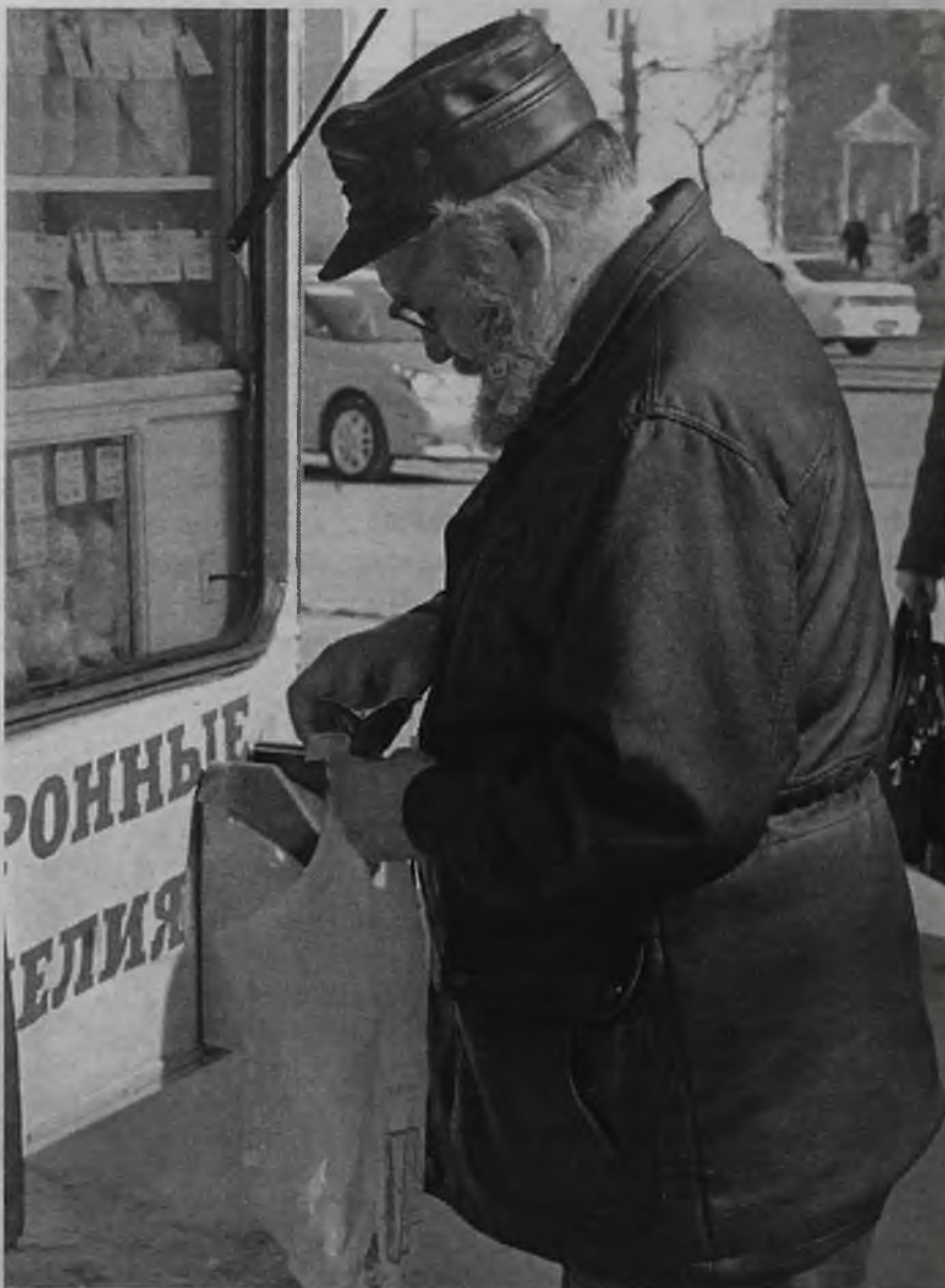
«Субсидию получил, за квартиру заплатил, теперь можно о продуктах подумать»