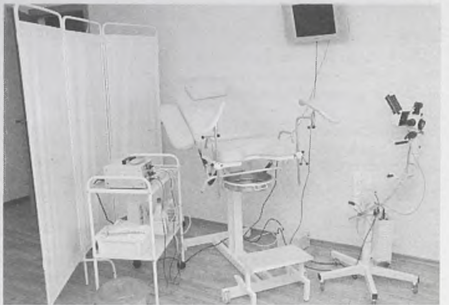
Современная диагностика женских заболеваний – видеокольпоскопия