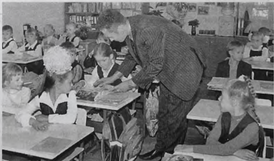
Иногда лучший учитель – родитель