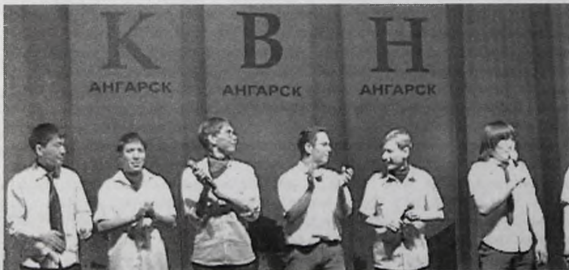
Драйв, оригинальность и обаяние – черты КВН в Ангарске

КВН сообщество Ангарска может спать спокойно. Клуб веселых и находчивых в нашем городе был, есть и будет, что в очередной раз доказал полуфинал первого сезона Первой радиоактивной лиги КВН России. Решающие игры полураспада (1/2 финала) прошли на сцене ДК «Энергетик» 13 и 15 марта.