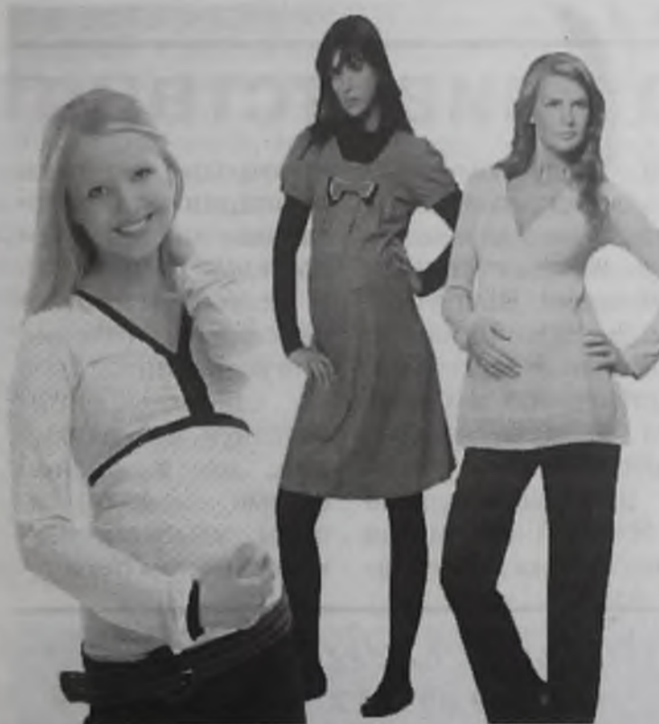
Появился красивый животик? Участвуем в конкурсе!

Самая красивая, нежная, таинственная и притягательная... Она – источник новой жизни, вселенная для нового человечка, целый мир на двоих. Беременность – удивительное время. Когда женщина расцветает заново, и открывает в себе такие чудесные стороны, о которых раньше и не догадывалась... Женская красота всегда вызывала трепет и восхищение у сильной половины человечества. И когда женщина носит в себе жизнь, она особенно прекрасна – прекрасна той удивительной гармонией и красотой, которую дарит беременность.