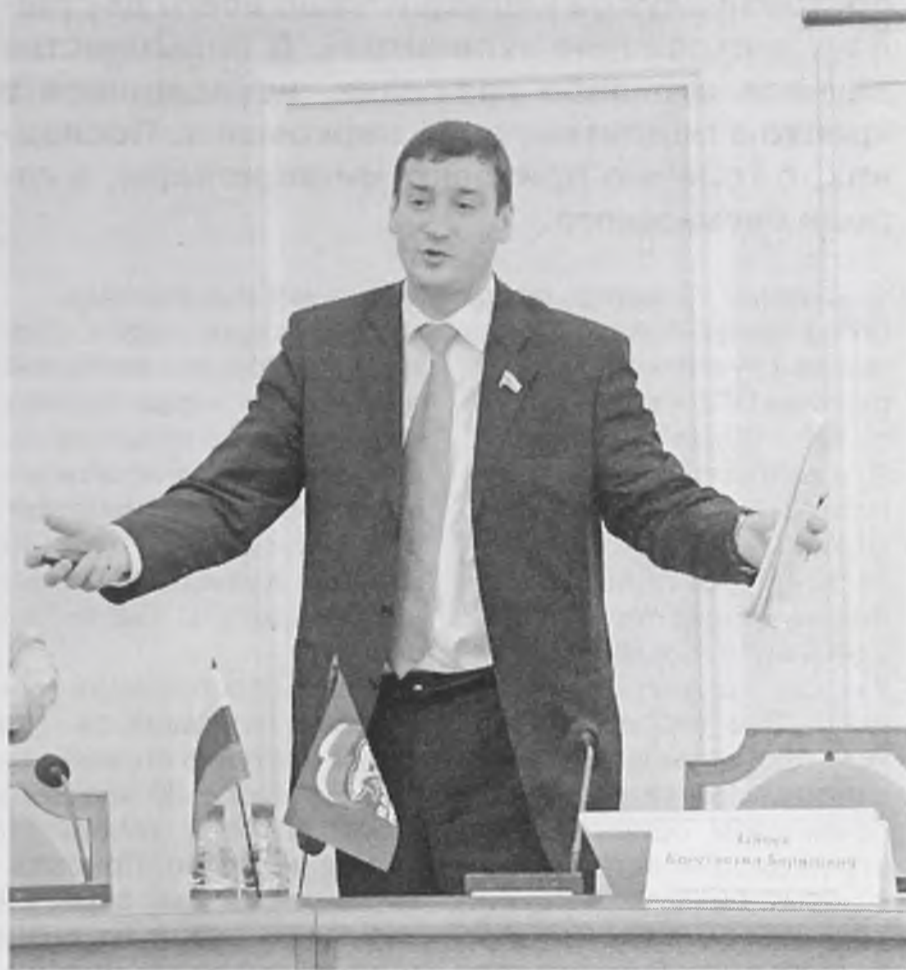
«Земля у нас богата, пора порядок наводить»