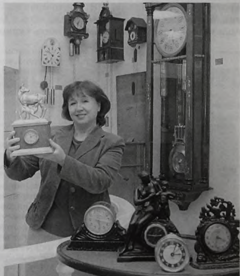
Еще идут старинные часы – ровесники музея