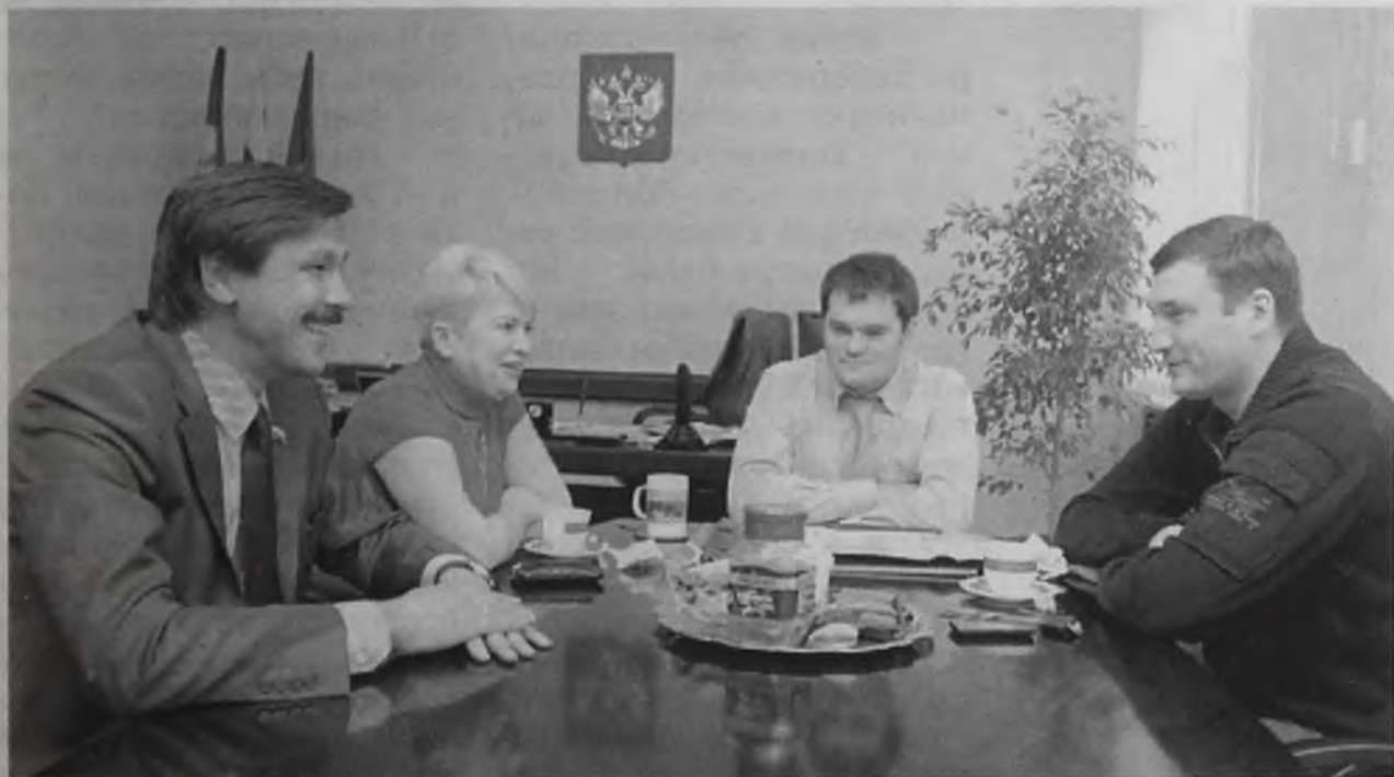
Это не просто четыре политика, это представители власти городского, районного, регионального и российского уровней. Чем лучше поймут друг друга, тем больше пользы для территории