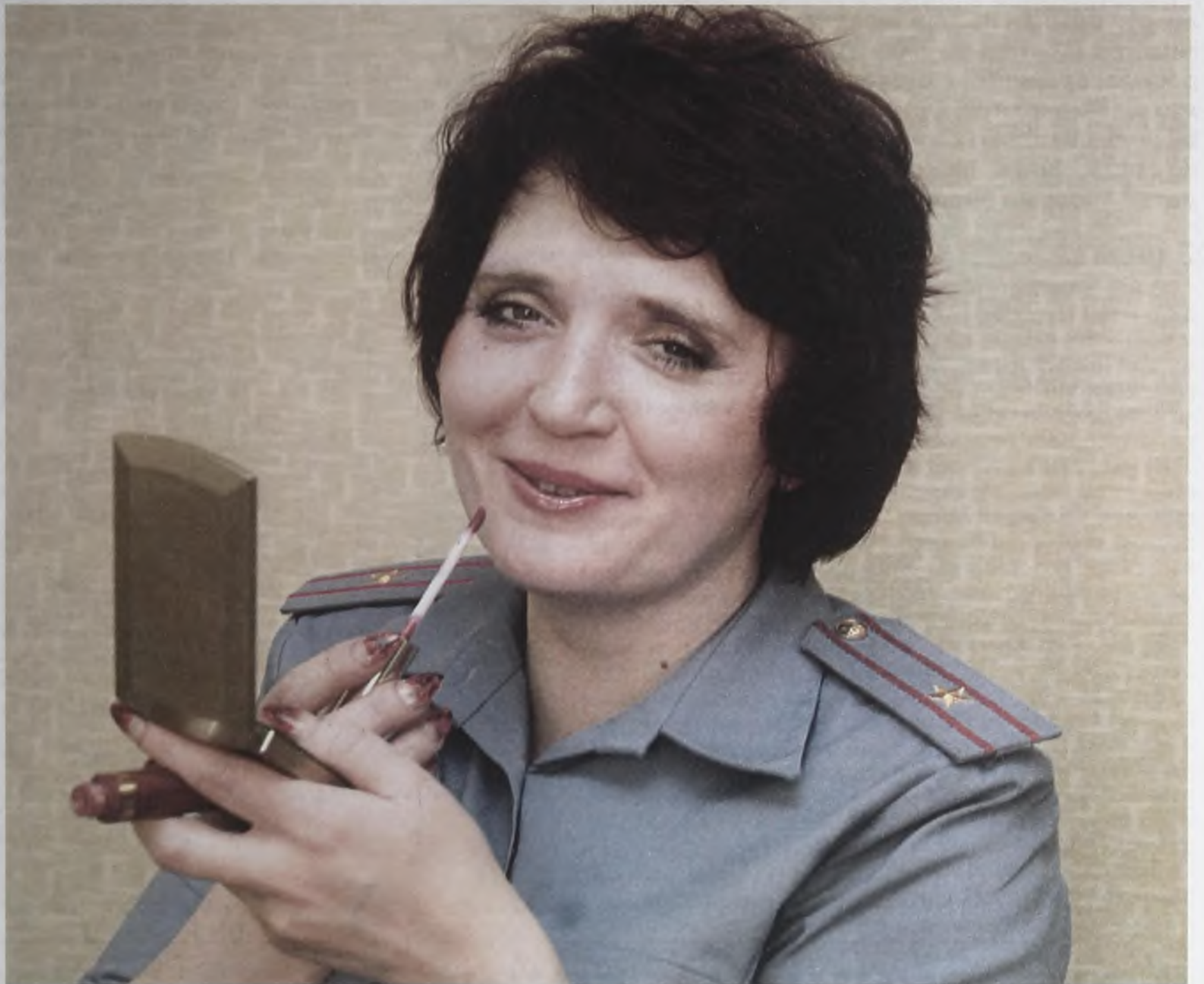
«Мировосприятие женщин в погонах и без них значительно отличается. У меня принципиальная оценка ситуаций: я сразу приступаю к их разрешению без подключения эмоций.»