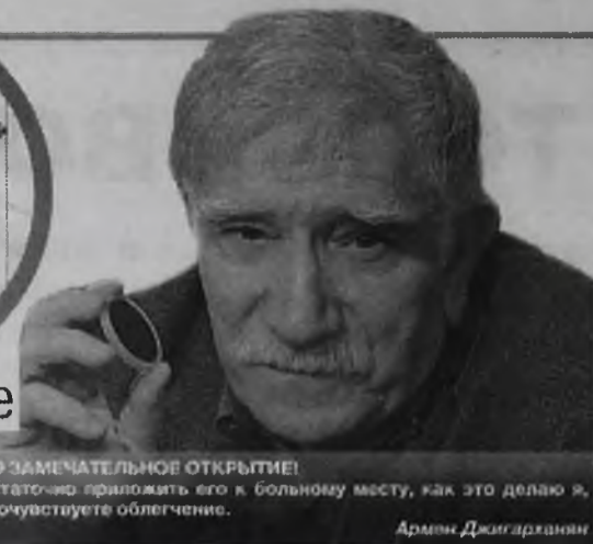
ЭТО ЗАМЕЧАТЕЛЬНОЕ ОТКРЫТИЕ! Достаточно приложить его к больному месту, как это делаю я, и вы почувствуете облегчение.