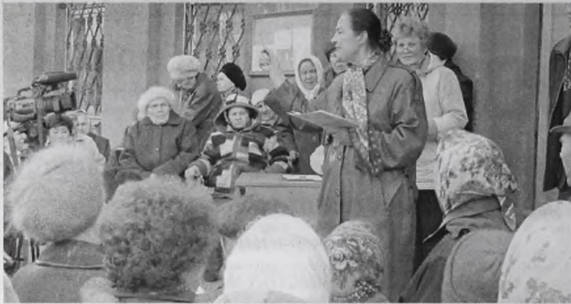
Сход жителей – возможность решить вопросы цивилизованно

Особенности формирования и расходования бюджетных средств – этот вопрос жителям Ангарского муниципального образования разъясняют депутаты и специалисты Центра развития местного самоуправления в ходе координационных Советов.