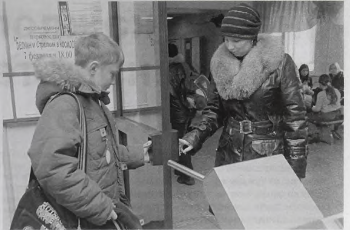
Надёжность, оперативность и гибкость управления – это основные преимущества электронной новинки

Биометрия сегодня выступает альтернативой традиционным системам контроля доступа, в ней есть явные преимущества: палец невозможно забыть как пароль, потерять как ключ или подделать как удостоверение. Система понижает вероятность проникновения нежелательных личностей, создает психологический барьер для потенци-