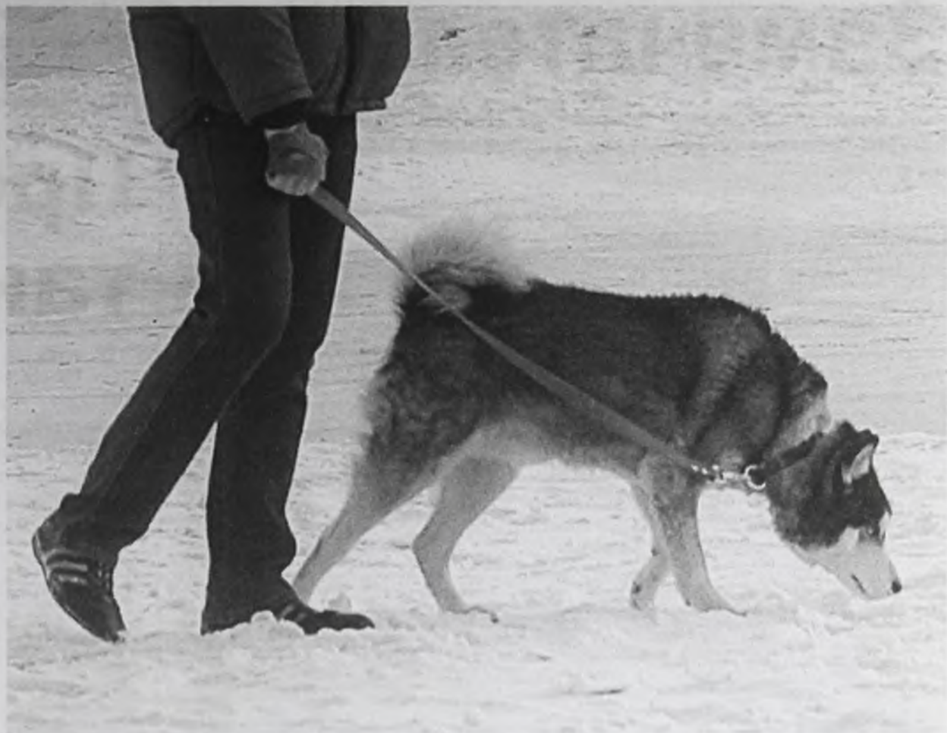
Поводок – защита от многих ЧП

– Наши дворники отраву даже в руках не держат! – заверяет нас начальник участка преддомовой территории уп-