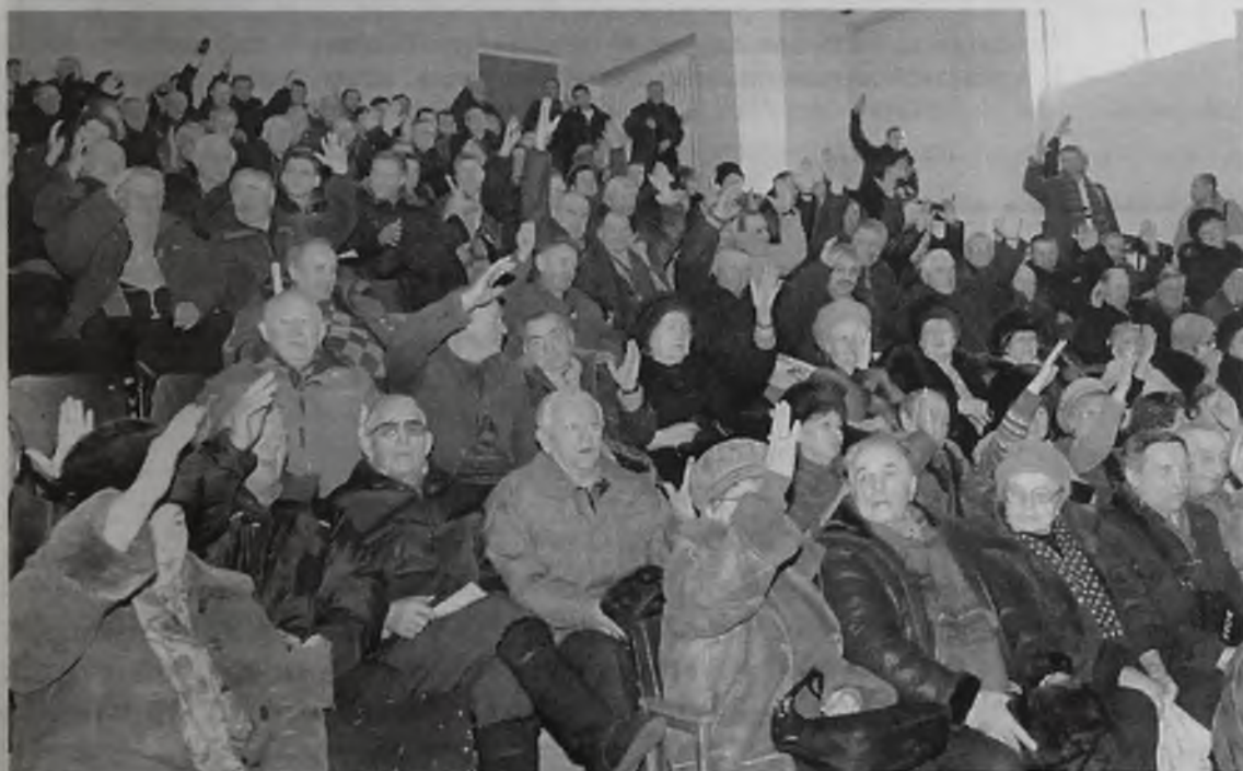
Инициативная группа от ГСК за диалог, но против резких решений