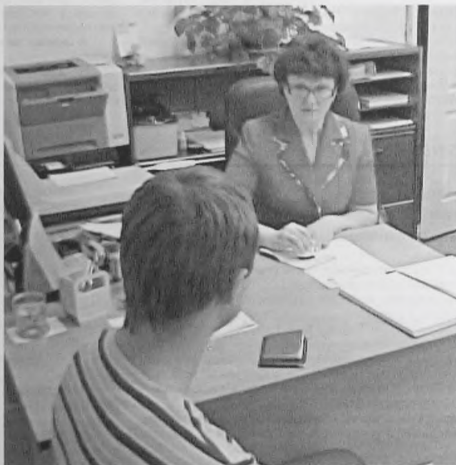
На процедуру сдачи пакета документов от каждого человека отведено 12-15 минут

Ангарск стал вторым городом в области, где теперь будет выдаваться заграничный паспорт нового поколения. В конце минувшей недели в отделе Федеральной миграционной службы запущено в работу сложное компьютерное оборудование.