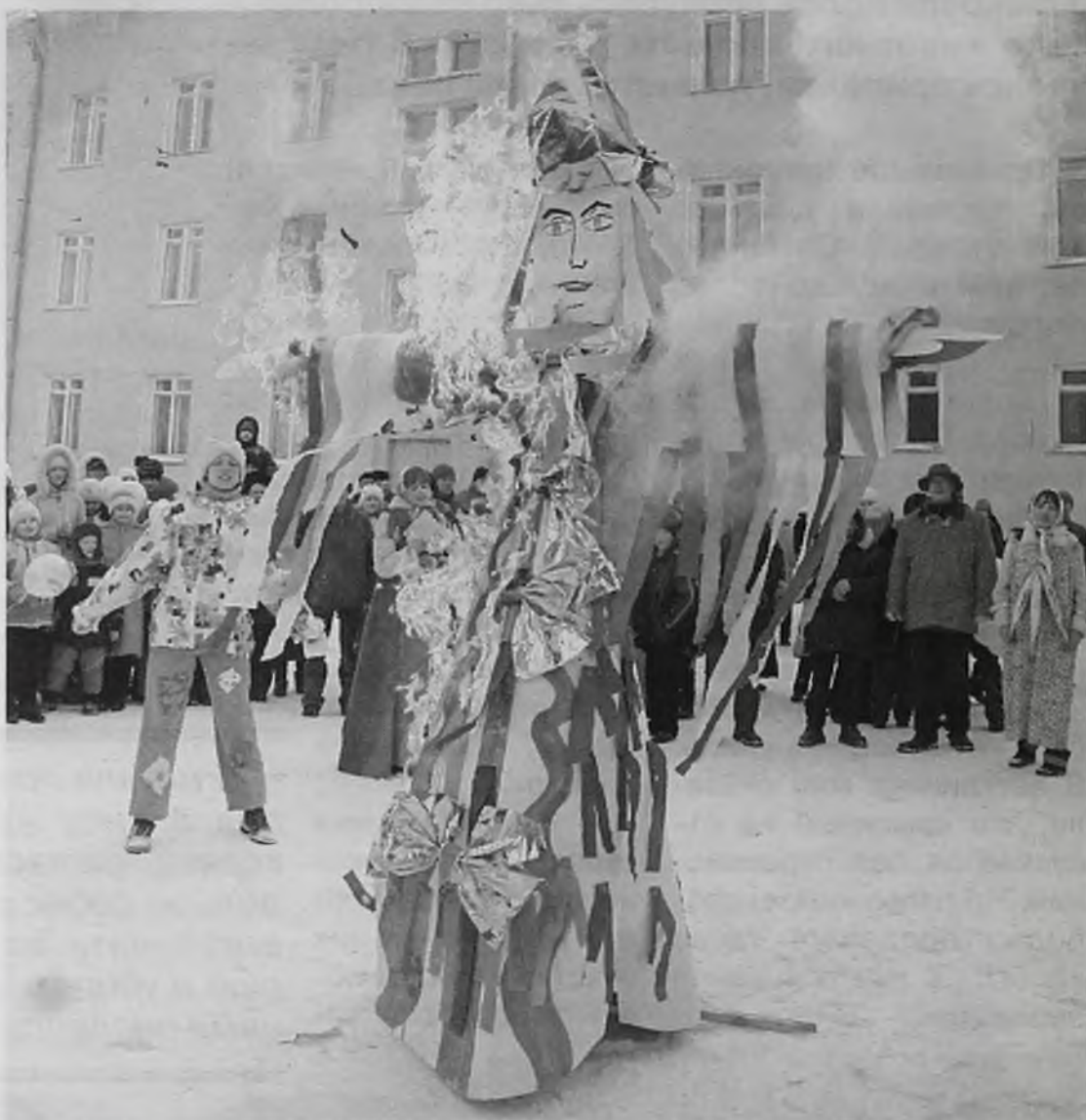
Две традиции в одном празднике. Будет здорово!