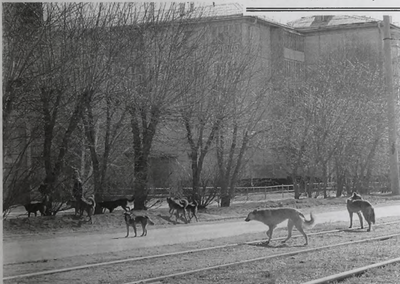
«Бездомность» четвероногих «клиентов» определяется исключительно по внешнему виду: грязные, неухоженные, худые, без поводков и ошейников

В начале прошлого года вступил в силу Административный кодекс, согласно которому владельцы собак должны не просто выгуливать их на поводке, но ещё и убирать за своими питомцами последствия выгула