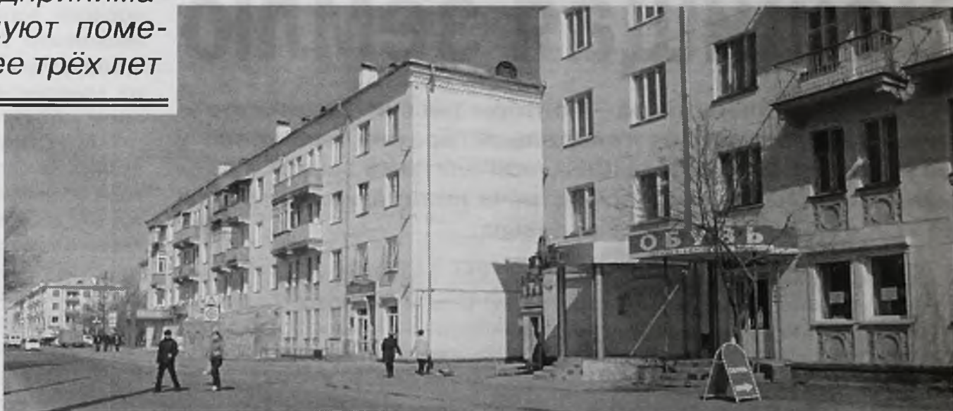
Чтобы выкупить арендуемый объект, необходимо соответствовать трём основным показателям: площадь, срок, добросовестность