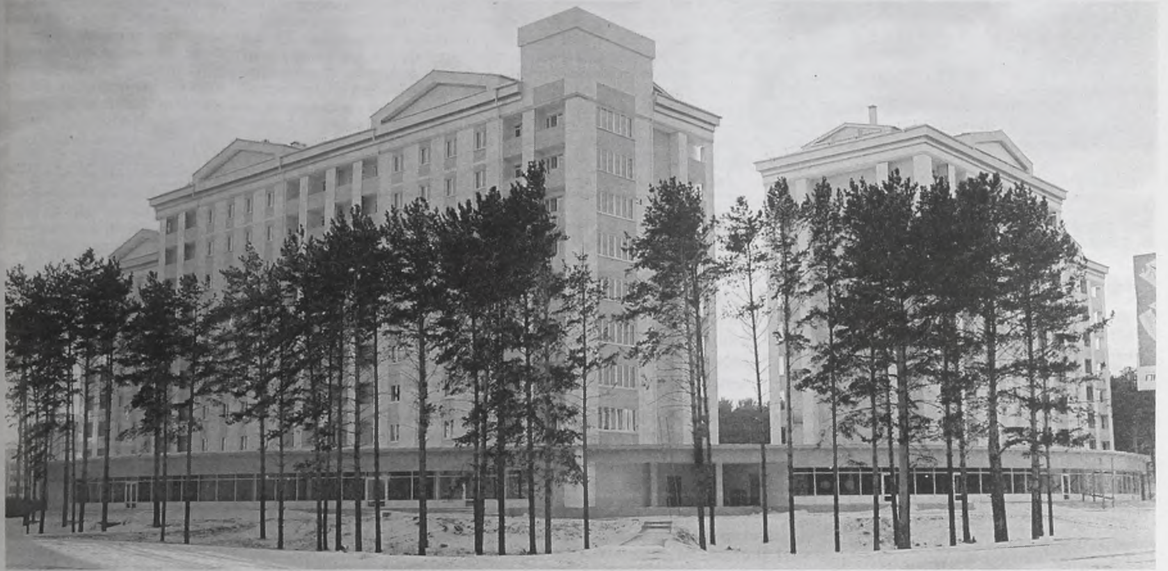
Из-за мирового финансового кризиса собственная квартира для многих остается красивой мечтой