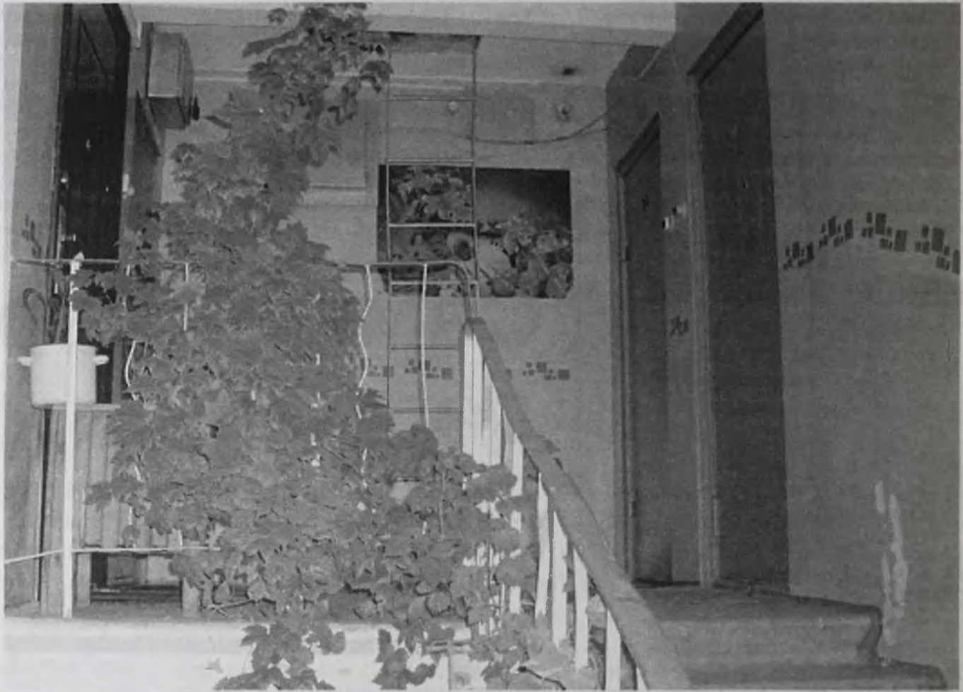
Прежняя «коммунальная» красота сохранилась в Ангарске только в подъездах