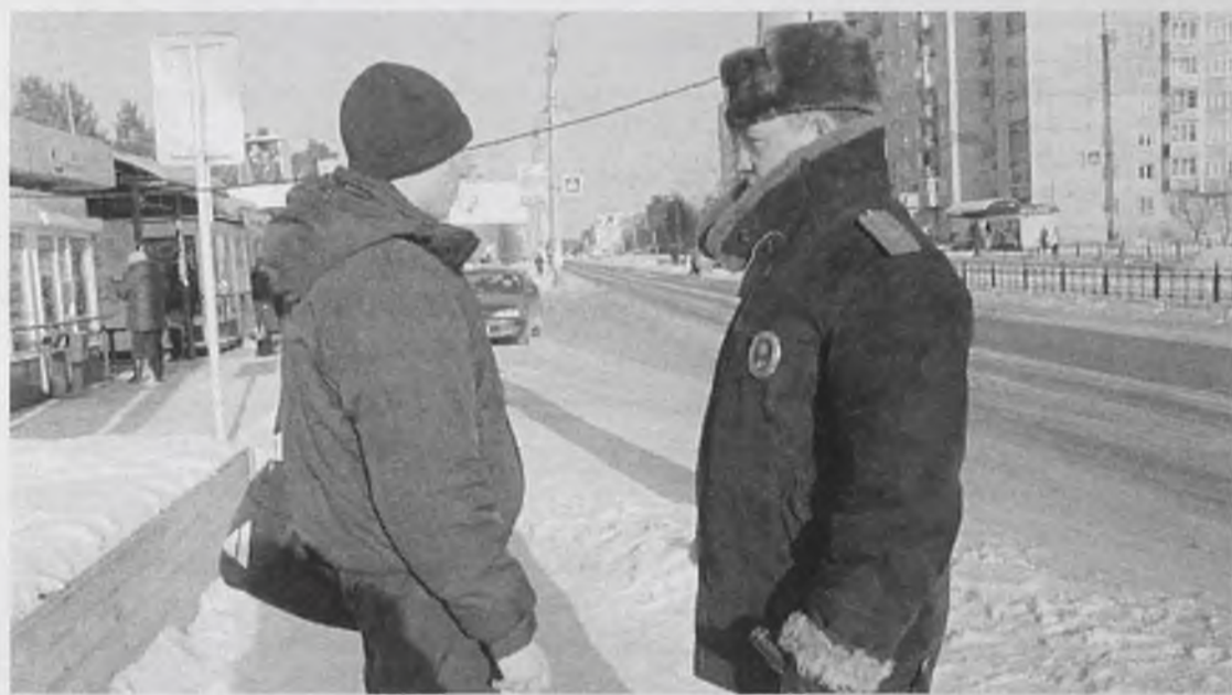
28 января. Рейд стартовал на оживленном переходе возле «Родины». И сразу – первый нарушитель

На дорогах Ангарска все чаще гибнут люди. С начала января водители сбили более 10 человек, в том числе трое детей, которые переходили дорогу в неположенном месте. Чтобы напомнить пешеходам правила дорожного движения, 28 января сотрудники ГИБДД провели профилактические рейды.