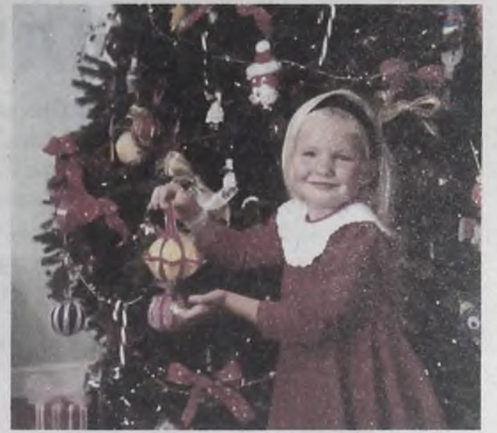
Чудеса своими руками

Любопытно, что традиция украшать елку разноцветными шарами в точности отражает реальную астрономическую карту неба, на котором планеты и звезды действительно окрашены в самые разные цвета.