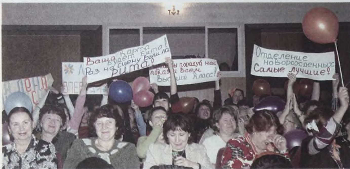
Большинство болельщиков - коллеги конкурсанток. Отсюда, видимо, столь яркая поддержка зрительного зала. С братством, вернее, «сестринством» белых халатов не поспоришь