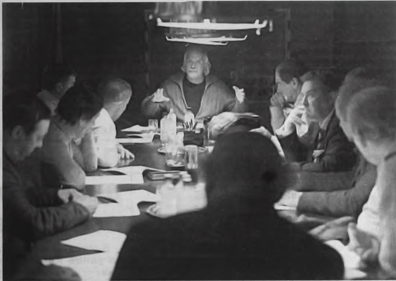
Миссию присяжных изнутри показал Никита Михалков в фильме «12». Действительно не позавидуешь