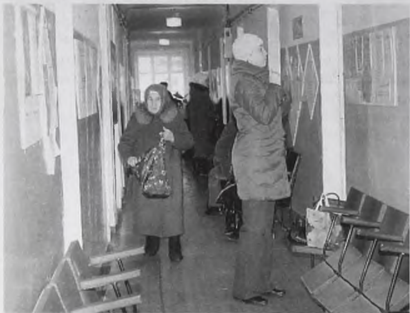
Оформить денежную компенсацию можно быстро и удобно

Предполагается, что граждан, оплачивающих жилье и коммунальные услуги с 50 % скидкой, с 1 января 2009 года ждут изменения. В законе, который находится на рассмотрении в Законодательном Собрании Иркутской области, будет указана дата, с которой все федеральные и региональные льготники вместо скидки начнут получать денежные компенсации на оплату ЖКУ.