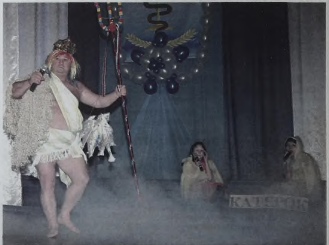
Ай да медсестрички! Вчера был просто пациентом... А сегодня царь морской