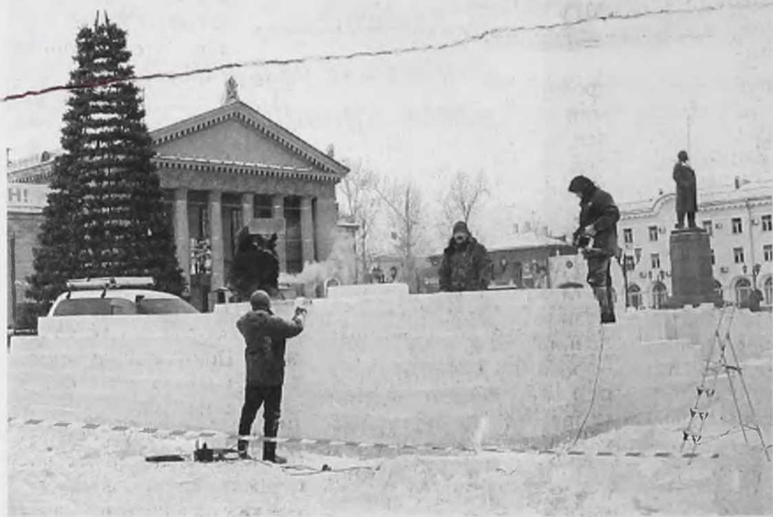
На центральной площади начали возводить ледовый городок