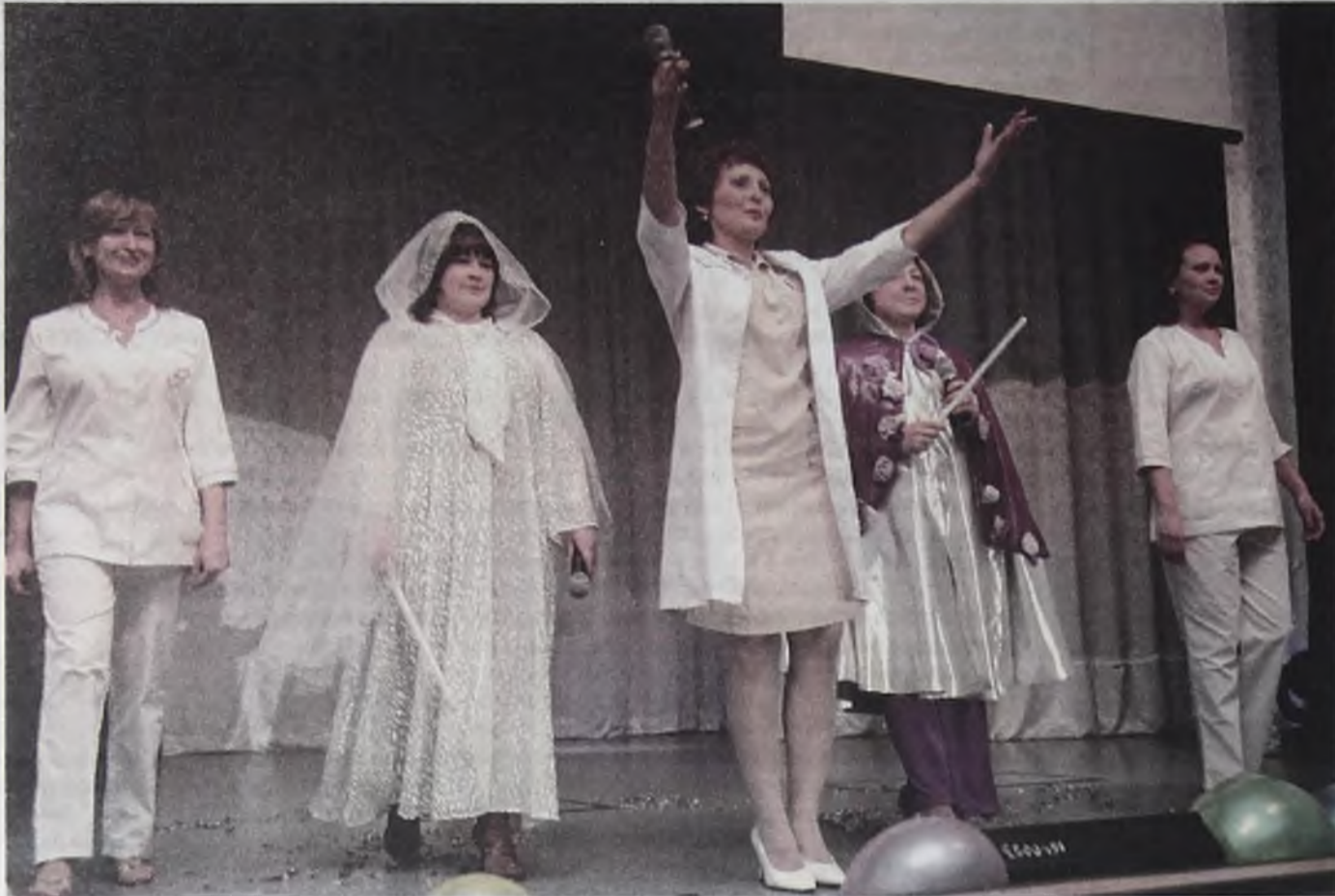
Добрые феи колдуют не только над Золушками, но и над медсестрами. Так и получают победители