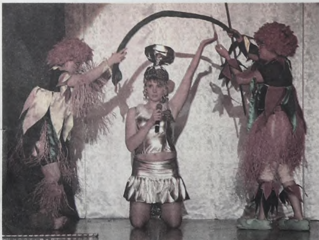
Второй этап конкурса назвали «Высокая мода медсестры». Не белый халат с чепчиком, а основные символы здравоохранения - чаша и змея