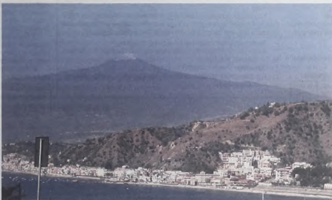
Главная достопримечательность Сицилии – вулкан Этна