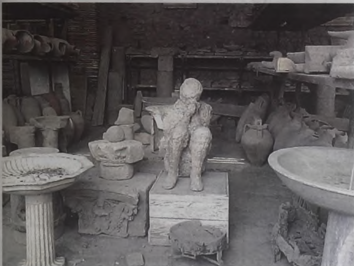
Их засыпало пеплом Везувия