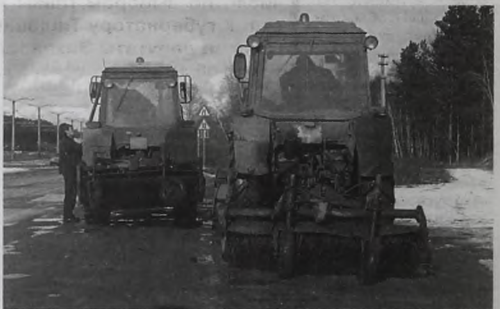
Пока городская власть безмолвствует, техника стоит