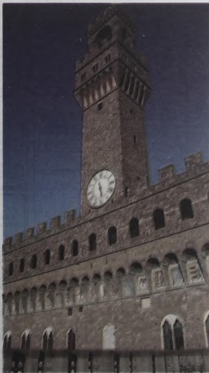
Галерея Уфици – средоточие мировых шедевров