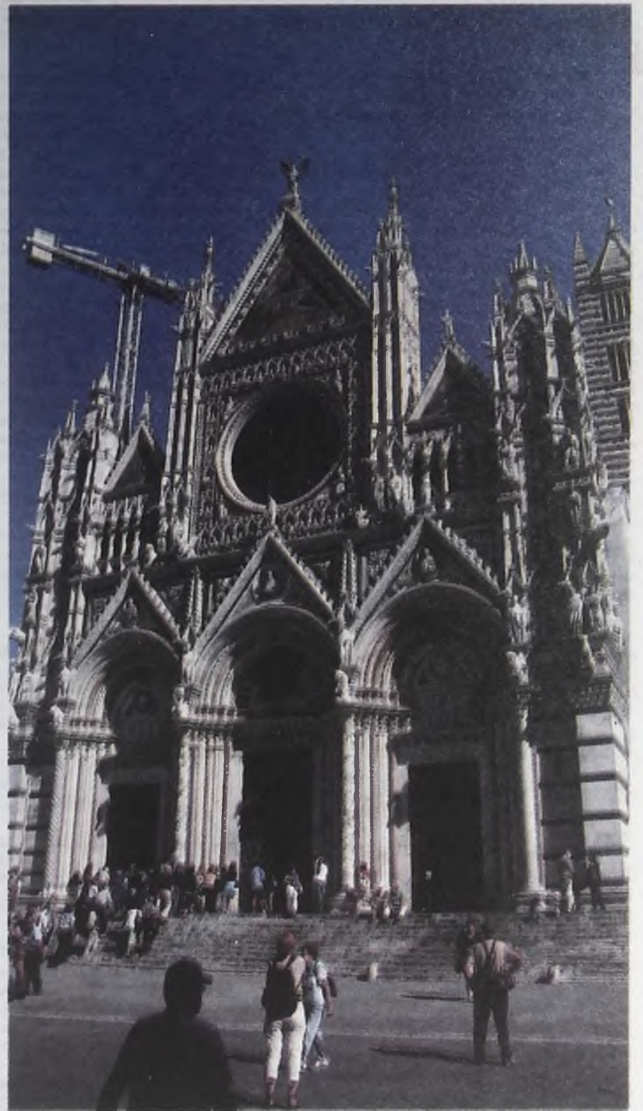
Эта флорентийская церковь из белого мрамора с золотым напылением очаровывает с первого взгляда

Гид торопит нас подняться с мостовой, потому что пора ехать во Флоренцию. Это действительно удивительный город, своего рода Мекка искусства. Здесь жили и творили многие гении Италии, сюда приезжали за вдохновением многие знаменитости. В городе царит особая обстановка творчества, свободы и гармонии. Достопримечательностей Флоренции не счесть, но мы давно мечтали побывать в галерее Уфици, чтобы увидеть картину «Рождение Венеры» Сандро Боттичелли. Однако, попав в нее, мы настолько заморожены количеством представленных шедевров, что не можем справиться с информацией уже во втором зале и до «Венеры» добираться нескоро. Во Флоренции находится и знаменитая мраморная скульптура Микеланджело «Давид». Один из переулков ведет к легендарной статуе флорентийского кабанчика, –