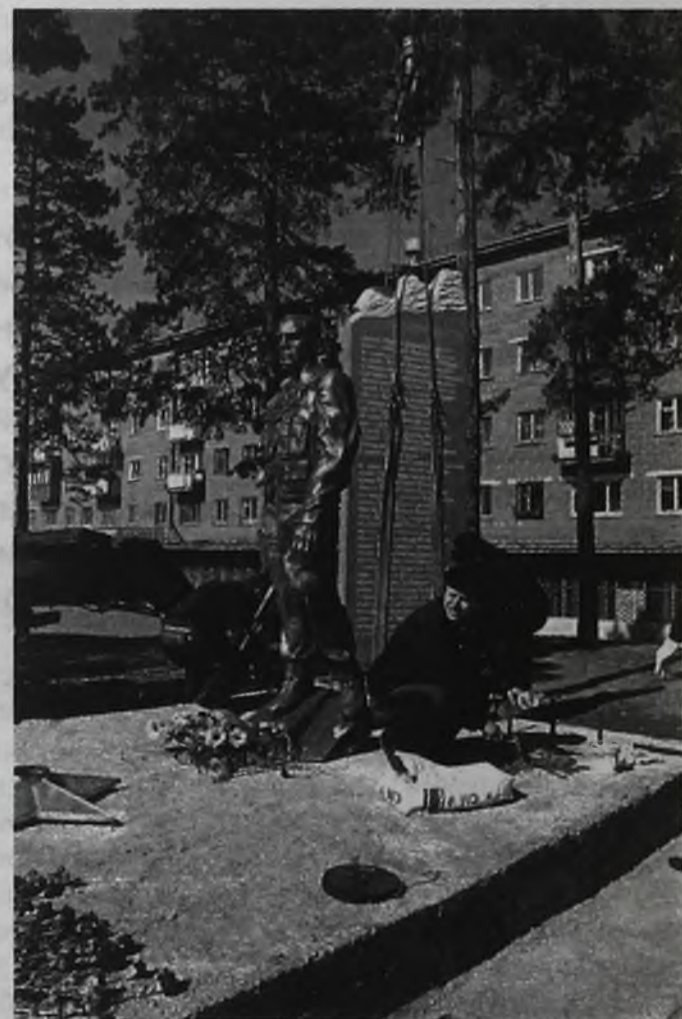
Мемориал был восстановлен 31 марта. Установлены новые стелы с именами погибших. Они изготовлены из цельных мраморных плит мастерами из Хакассии. С наступлением тепла лестница, ведущая к монументу, и площадка вокруг него будут выложены черными мраморными плитами. Слева от мемориала разобьют сквер, установят скамейки и освещение. Весь комплекс будет находиться под круглосуточной охраной милиции