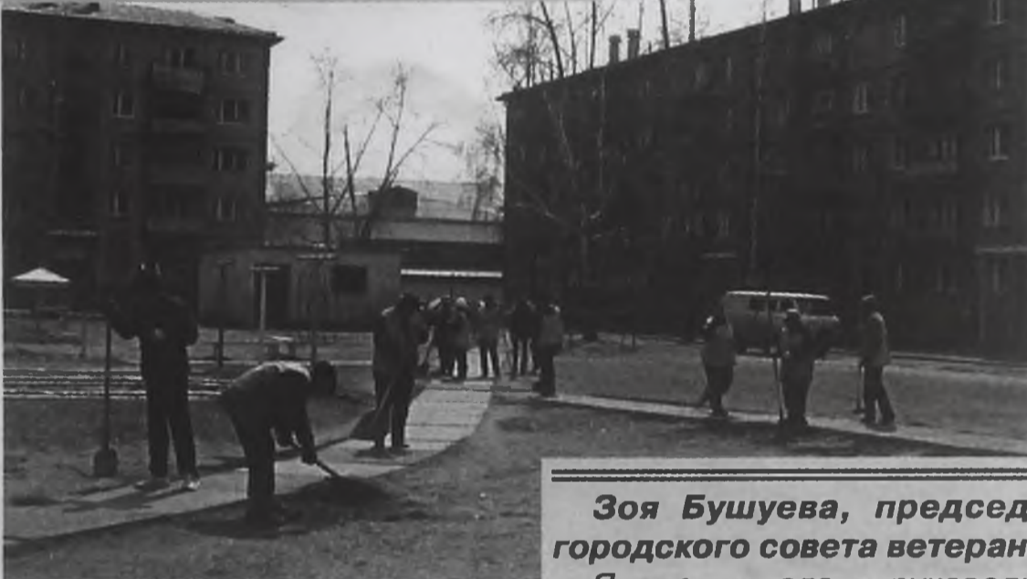
К каждому своему двору «Жилищное управление» подходит ответственно

«Я подписала по неосмотрительности договор с «ЖЭКом», а они только деньги берут. Я к ним обратилась за справкой о составе семьи, а они мне её не дали. Они и прописывать-выписывать людей в квартирах не могут».