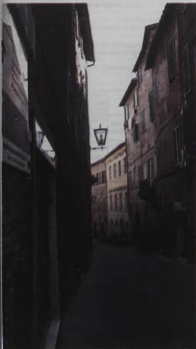
В Сиене традиционно узкие улочки