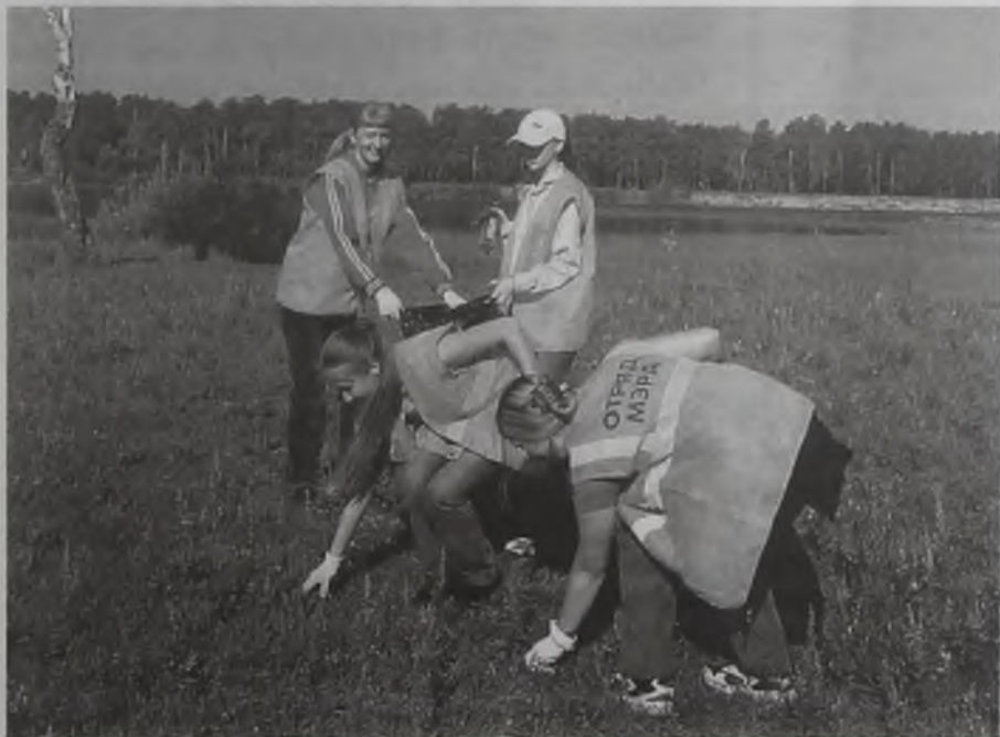
Отряды мэра за август прошлого года собрали более 20 тонн мусора

в течение месяца занимались уборкой территорий, которые не входят в зону ответственности жилищных управляющих компаний и фактически являются бесхозными. Результат оказался положительным: мало того, что за 30 дней из поймы реки Китой, городских парков и других мест было убрано более 20 тонн мусора, так еще ребята и лето провели с пользой, и получили за свой труд вознаграждение. Когда проект закончился, участники часто спрашивали, продолжится ли такая работа в будущем году? В администрации решили, что продолжится.