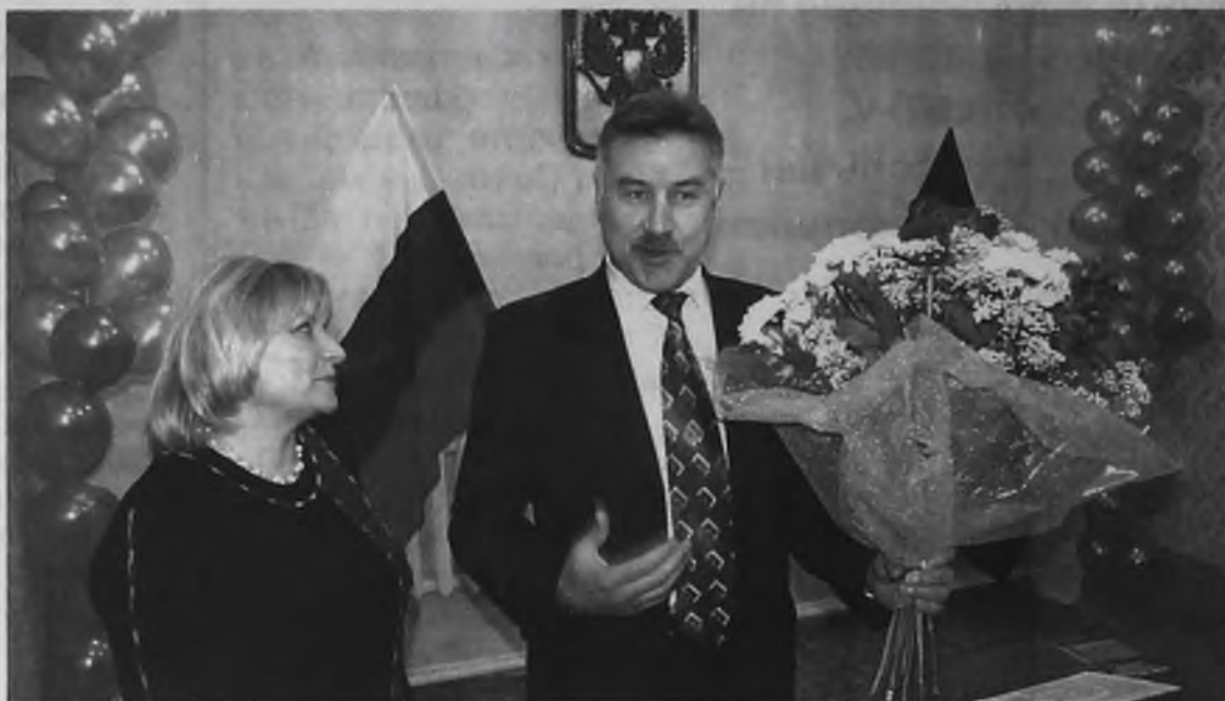
Нового главу Мегета приехали поздравить коллеги из района

– В Мегете около 10 тысяч жителей, из них более 2 тысяч пенсионеров. Основное градообразующее предприятие – завод металлоконструкций – 10 лет назад растерял своих основных специалистов.