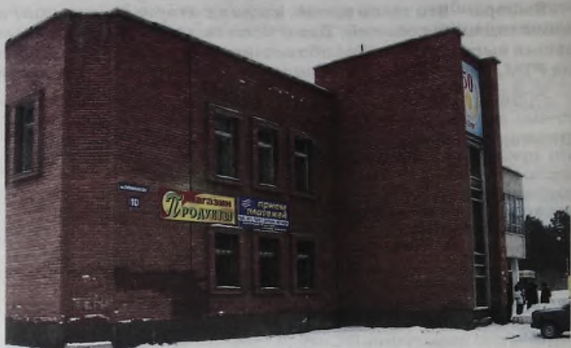
Закон возлагает на АЭХК обязанность привести ведомственные объекты в порядок. И только затем передавать городу

ном для себя свете. Так родилась сказка о том, как город якобы отказывается принимать здания на свой баланс. Ближе к выборам вопрос из сферы экономики перевели в политическую