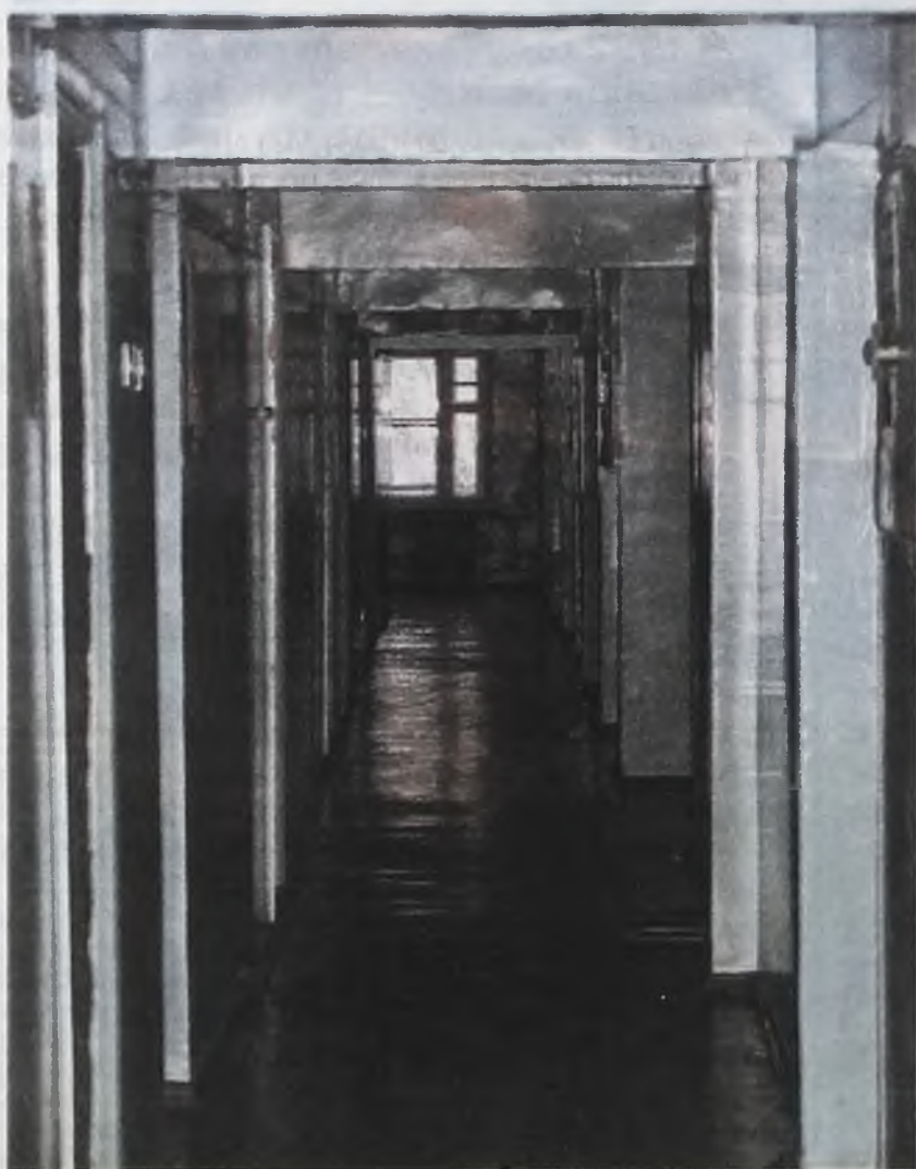
По коридорам общежитий АЭХК распускаются слухи, что город их не берет. Но все обстоит иначе

Естественно, сказать об этом прямо представители комбината жильцам не захотели. Предпочли преподнести ситуацию в выго-