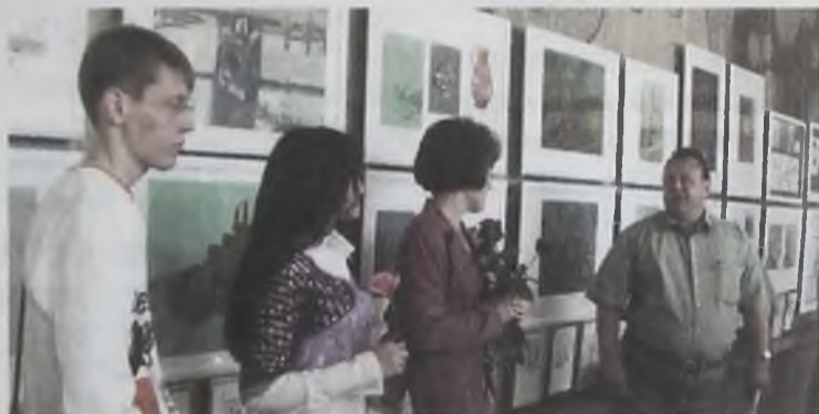
Объявление о получении стипендии ангарского Цементзавода ребятам художественной школы №7

Персонал, дети, родители знают о роли цементзавода в жизни детского сада.