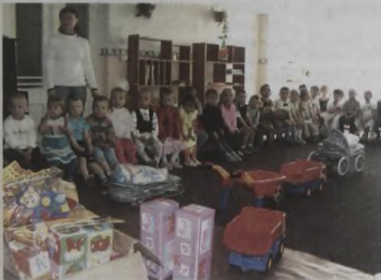
Детсадовцы и подарки к 1 июня

«В 1963 году Ангарский цементный завод построили, а в 1964 году запустили в эксплуатацию для детей работников завода детский сад № 76. До 1993 года детский сад находился на балансе завода, а затем перешел в муниципальную собственность.