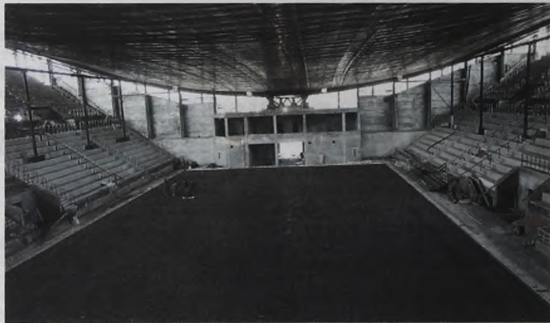
Так крытый стадион «Ермак» выглядит сейчас

состоится уже 30 ноября – в 15 часов на «Ермаке» отпраздную свадьбу. Узами брака сочетаются четыре молодые пары. А с 17 до 19 часов арена будет открыта для массового катания.