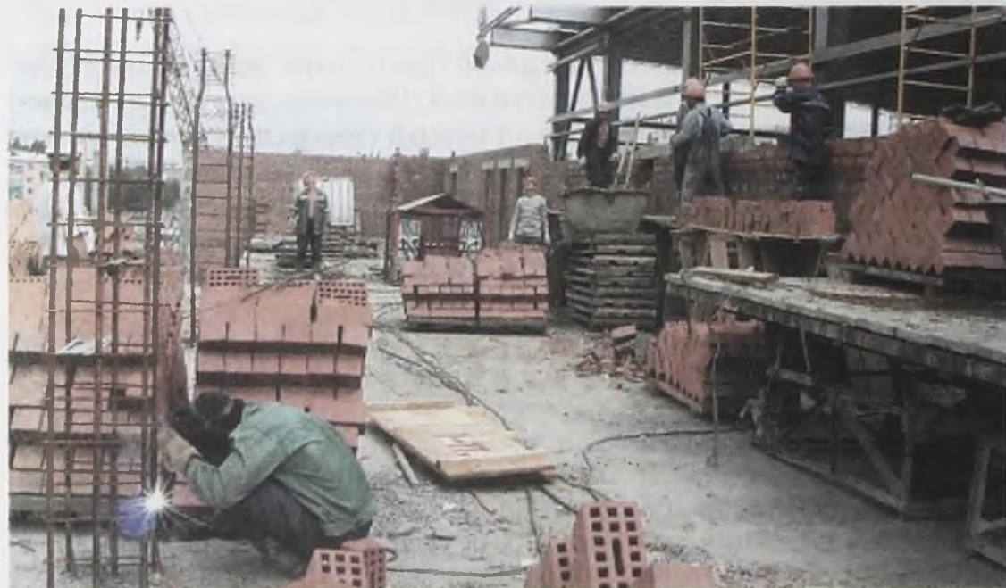
Так начиналась реконструкция в 2003 году

Еще один интересный проект, на который уже нашлись инвесторы, – это соответствующая меж-