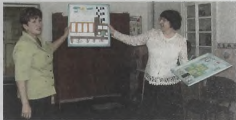
Картина в подарок цементзаводу от воспитанников детсада №76