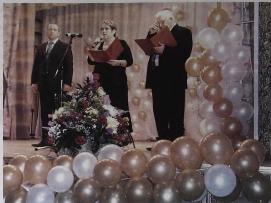
Поздравляет администрация Слюдянского района

Почетную обязанность по вручению наград работникам карьера исполнил технический