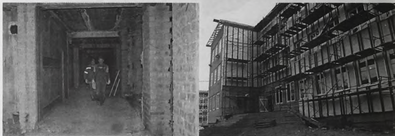
В роддоме работы идут полным ходом

– Первым планируем сдать блок начальной школы, – рассказал исполнительный директор иркутской фирмы «Промстроймонтаж», подрядчик строительства Вла-