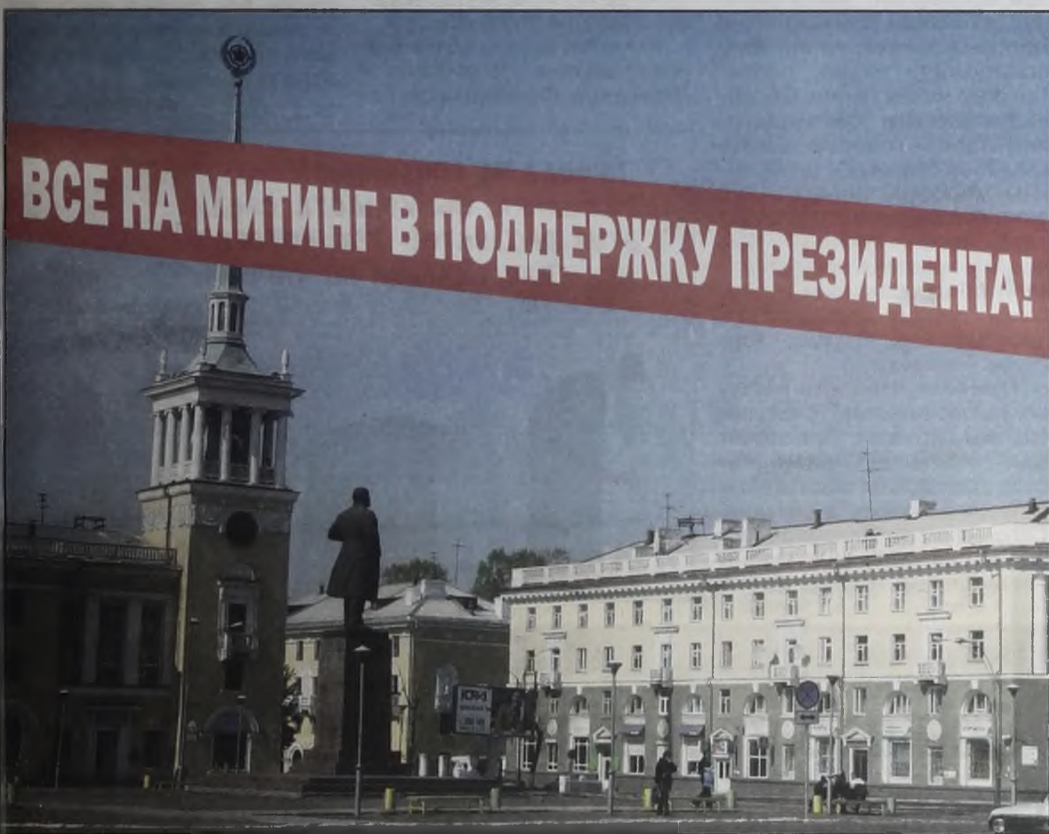
4 ноября в 16.00 на пл. Ленина в Ангарске пройдет митинг в поддержку Президента. Ангарчане, присоединяйтесь!