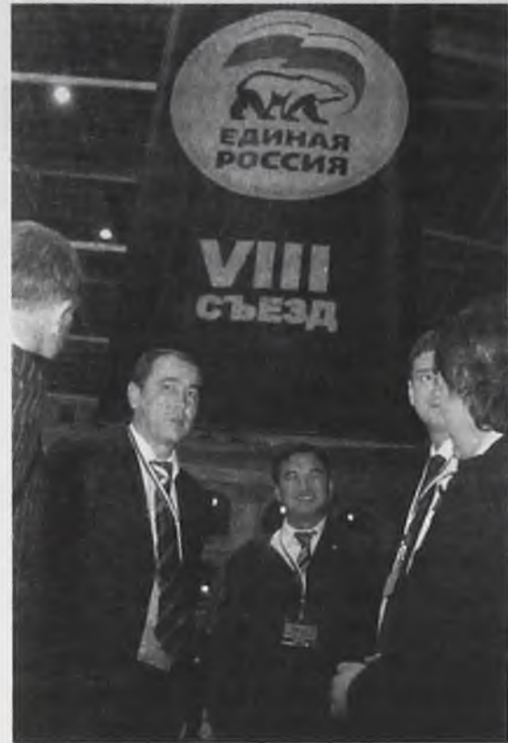
Губернатор Александр Тишанин пообещал подтвердить доверие Президента реальными делами.

Съезд проходил в Гостином Дворе, история которого начинается с 14 века. Здание, расположенное в 150 метрах от Кремля, является собой пример классической русской архитектуры – строгой и изящной одновременно. Наверное, не случаен был выбор организаторов – единороссы продемонстрировали верность традициям. На съезде присутствовали более 3000 делегатов и приглашенных, почти все губернаторы, депутаты Государственной Думы и сенаторы Совета Федерации, около 20 зарубежных делегаций.