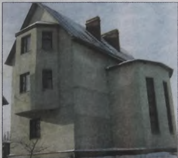
Мощность нового завода по производству малоэтажных домов составила 60 тысяч квадратных метров в год

В Иркутской области в 2007 году планируется ввести 500 тыс. кв. м жилья.