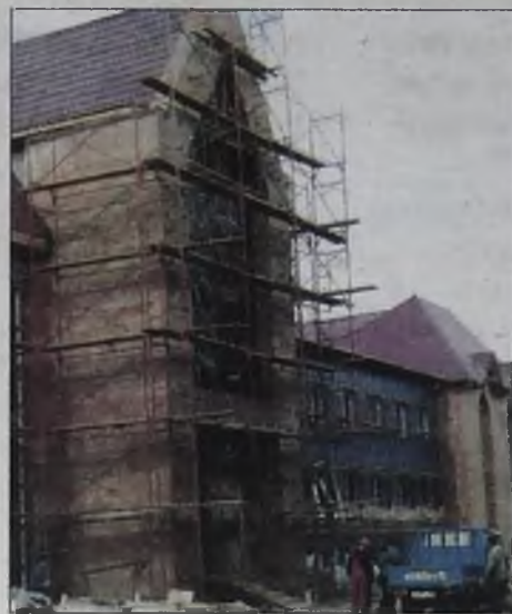
Строящаяся больница в Куйтуне — один из примеров нового подхода к финансированию социальных объектов