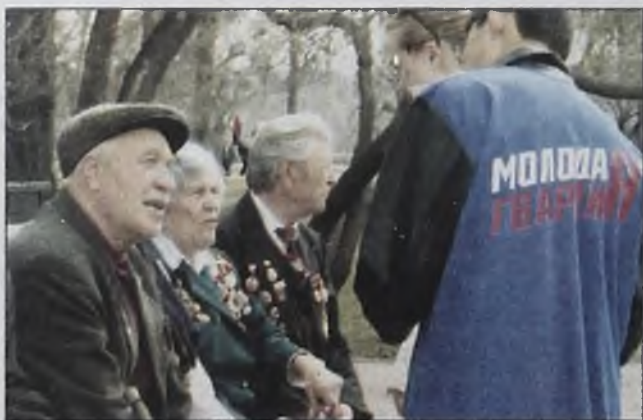
Возрождение патриотизма — это самый важный итог семилетней работы «команды Путина».