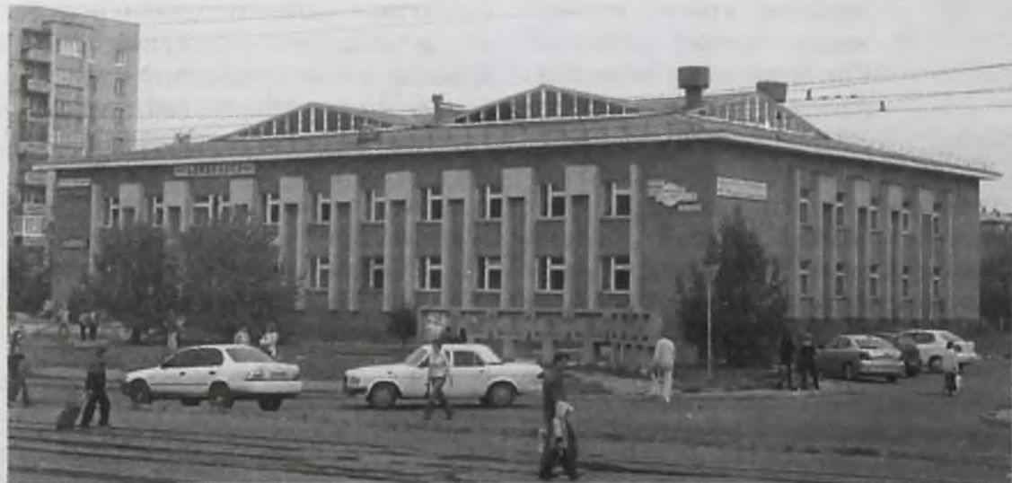
«Мы сами участвуем в том, что город меняется к лучшему. Кровля Школы искусств № 3, которую мы делали, сегодня самая красивая в Ангарске»