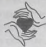
Городской социальный проект «ЗАЩИТА И ЗАБОТА»

... Над парком строителей разносится завораживающий голос Валерия Ободзинского, звучит озорная «Малиновка» и другие мелодии прошлых лет. Потом за дело берется духовой оркестр одной из ангарских воинских частей. Народ приближается к танцевальной площадке, на которой в вальсе кружатся пожилые люди.