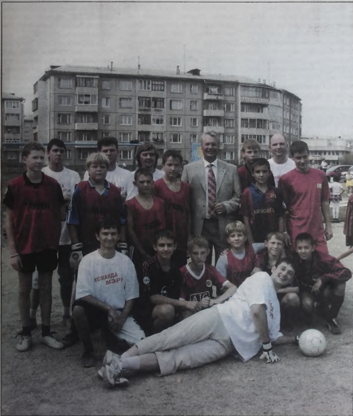
К открытию новой спортивной площадки приурочили товарищеский матч между сборной администрации Ангарска и сборной команды «Наш дом»