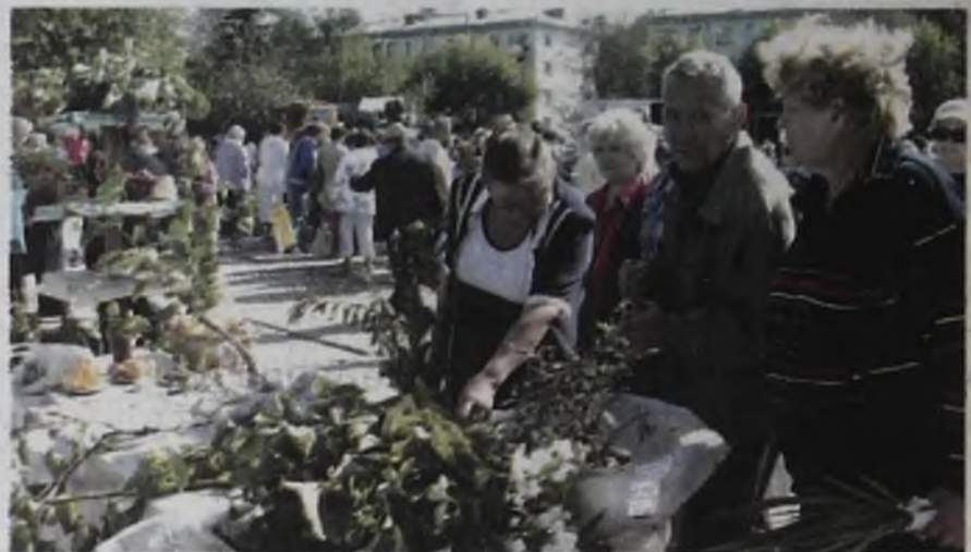
Смородина, вишня, крыжовник, ранет, груша, черноплодная рябина... Саженцы этих плодовых культур знаменитого питомника «Малиновское» шли на празднике урожая нарасхват.