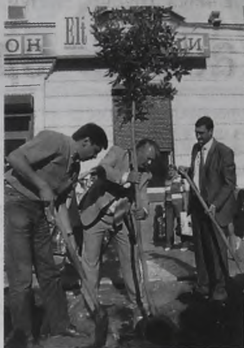
Первое дерево от первых лиц

да-то улица Карла Маркса носила имя Иосифа Сталина, и лишь в начале 1960-х была переименована. С тех пор центральный проспект капитально не ремонтировался ни разу. А сейчас благодаря инициативе президентской партии и администрации города она не уступит по красоте улицам современных мегаполисов.