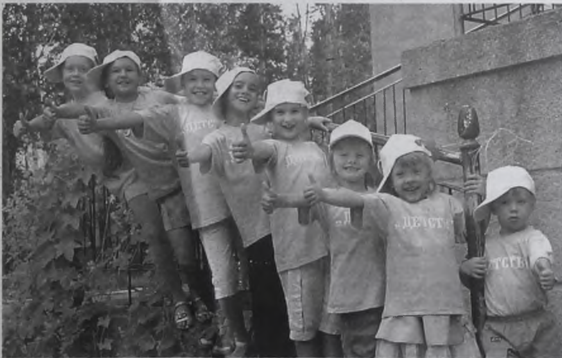
... а дома, в Ангарске, лучше!

Волновались, переживали, ведь в жюри – настоящие асы танцевального искусства из Москвы, в том числе солистка балета «Тодес», ныне преподающая в ГИТИСе. Тем более желанными оказались черноморские фестивальные награды, которыми можно гордиться.