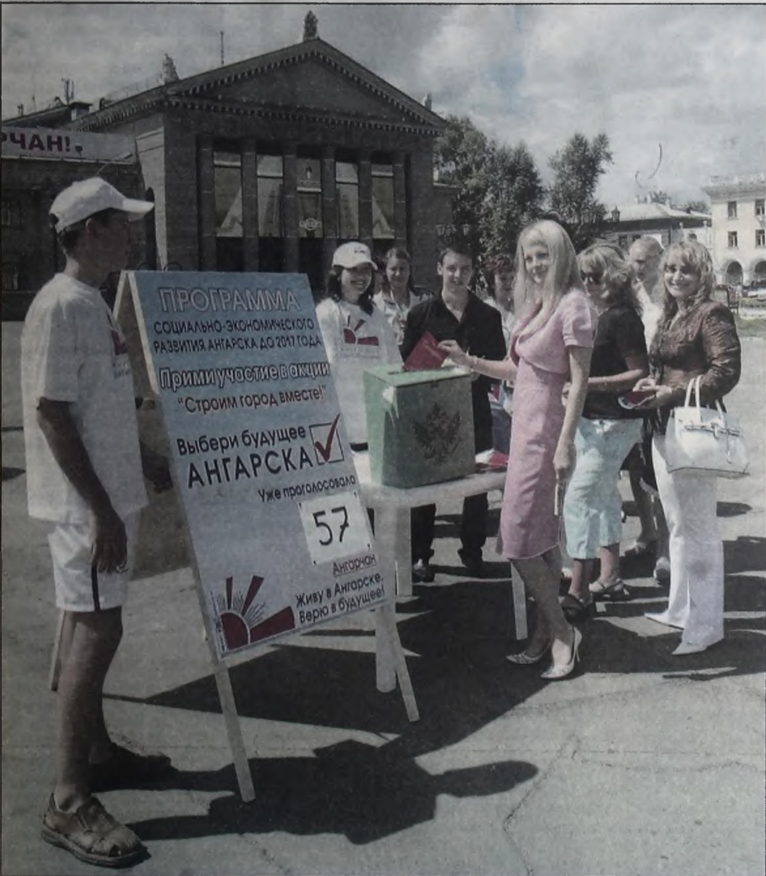
Во вторник на Центральной площади Ангарска стартовала акция «Строим Ангарск вместе!». Молодые ангарчане вовлекли горожан в живое обсуждение Программы развития города до 2017 года