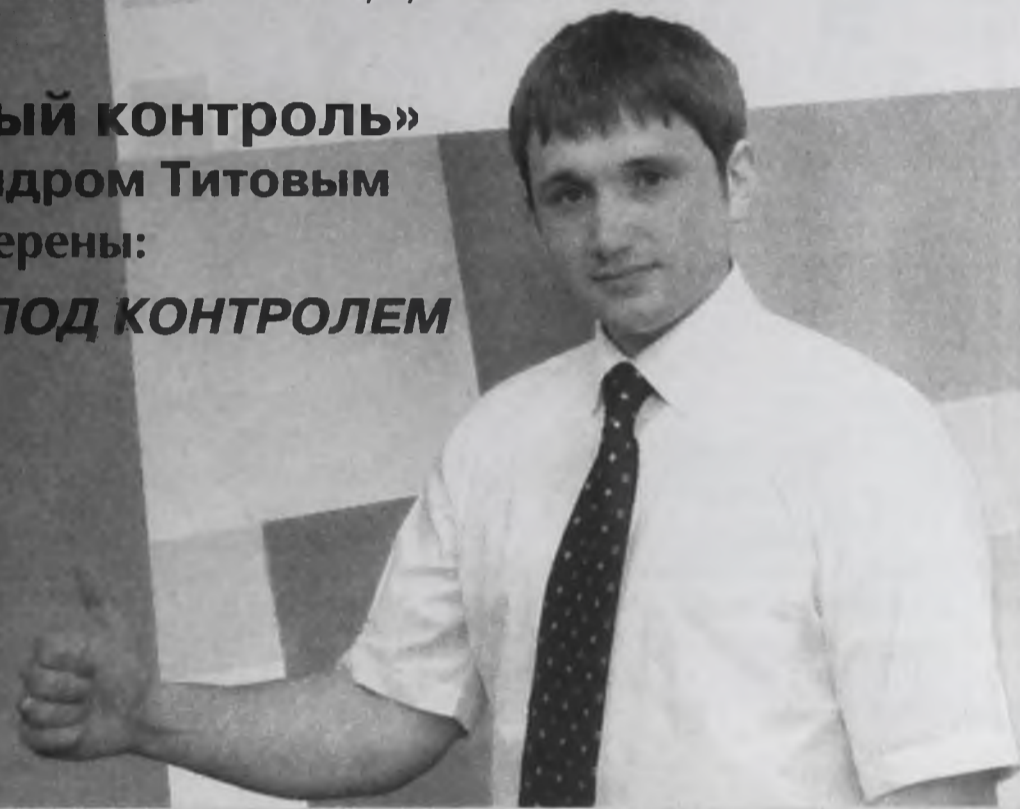
Время выхода программы «Народный контроль»

в эфире телекомпаний «Актис»: четверг, 19.00 (с повтором в пятницу в 19.00 и в понедельник в 19.00) в эфире телекомпаний «НТА»: четверг, 19.30 (с повтором в пятницу в 20.00 и в субботу в 20.00)