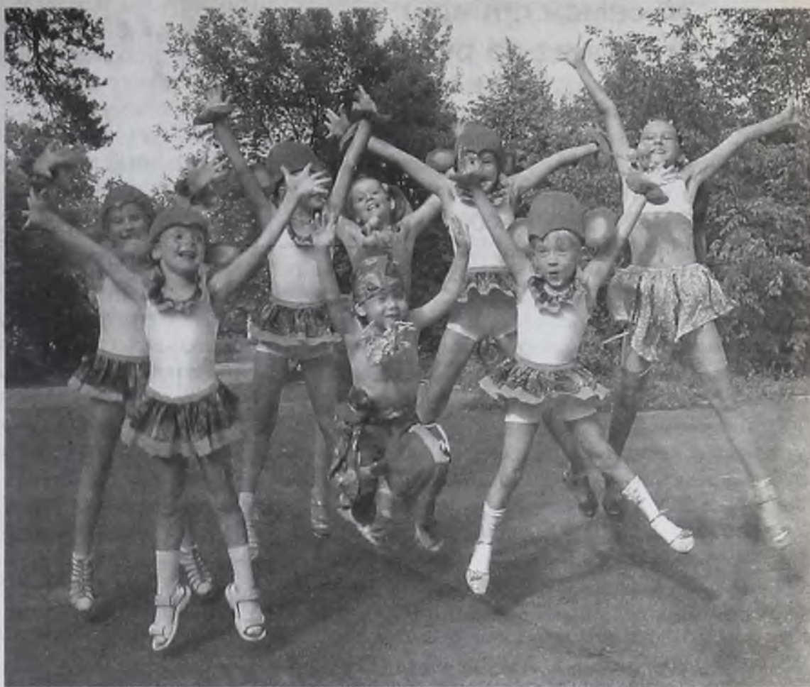
В Анапе хорошо...