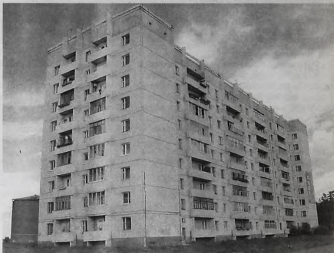
Для жителей верхних этажей этого дома холодная вода давно стала настоящей роскошью

Зачем, в чьих интересах предприниматель Комаровский упрямо портит жизнь целому подъезду жильцов, для всех до сих пор загадка.