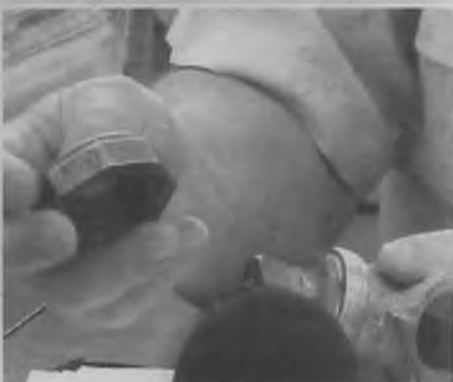
50 граммов бронзы могли стоить жизни более 5 тысяч людей