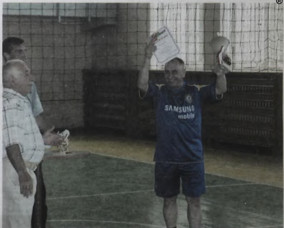
Победитель - цех «Обжиг»