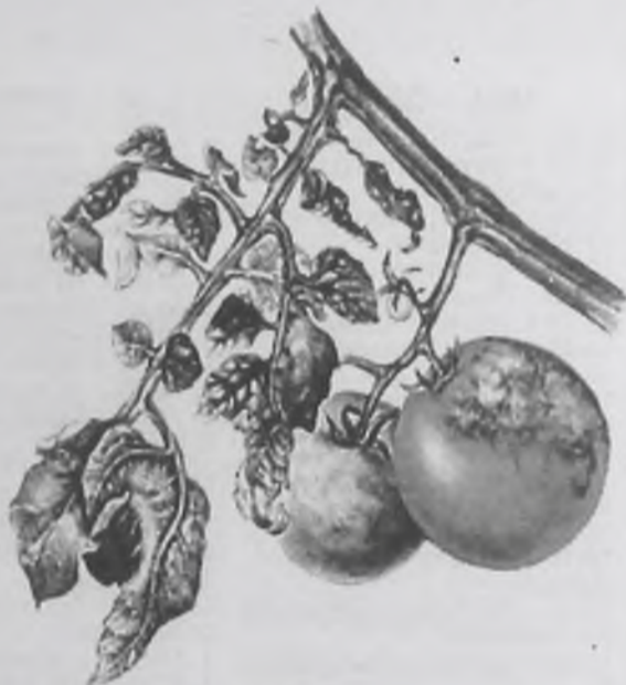
Так выглядят поврежденные фитофторой томаты

Химические средства защиты растений на садовых участках следует применять лишь в крайнем случае. А чтобы предотвратить поражение растений фитофторозом, необходимо постоянно проветривать теплицы, поливать растения только теплой водой, своевременно удалять нижние листья, обрывать пасынки из каждой пазухи листа, когда они отрастают до 5 сантиметров. Их следует выламывать, а не срезать, чтобы не перезаразить растения вирусными болезнями. Повышают устойчивость к болезни подкормки фосфорно-калийными удобрениями (по 30-40 граммов суперфосфата и столько же сернокислого калия на 10 литров воды). Первую осуществляют в начале образования завязей, вторую – через 2-3 недели. Перед цветением, а также при образовании завязей и в начале созревания плодов в воду для полива полезно добавить марганцовокислый калий (1 грамм на 10 литров воды).