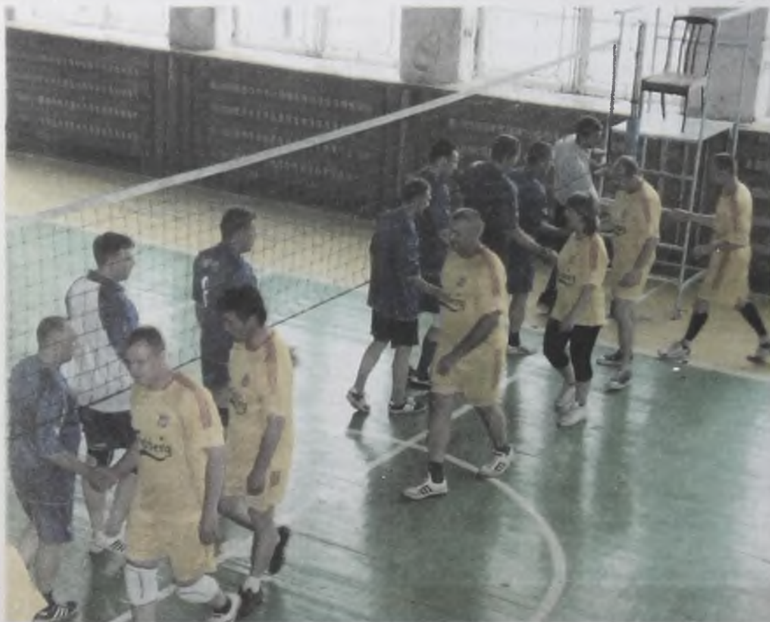
Команды приветствуют друг друга