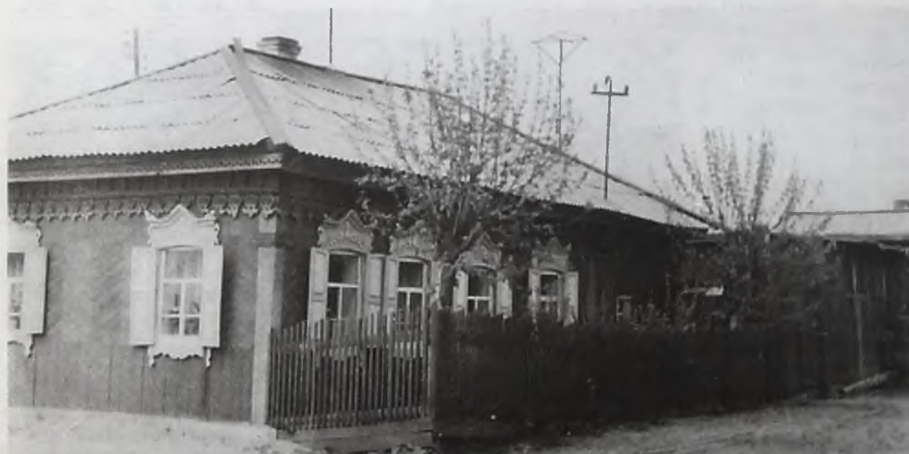
Китой, 1961 год. До пожара в 1990 году здесь жила дружная семья Жмуровых