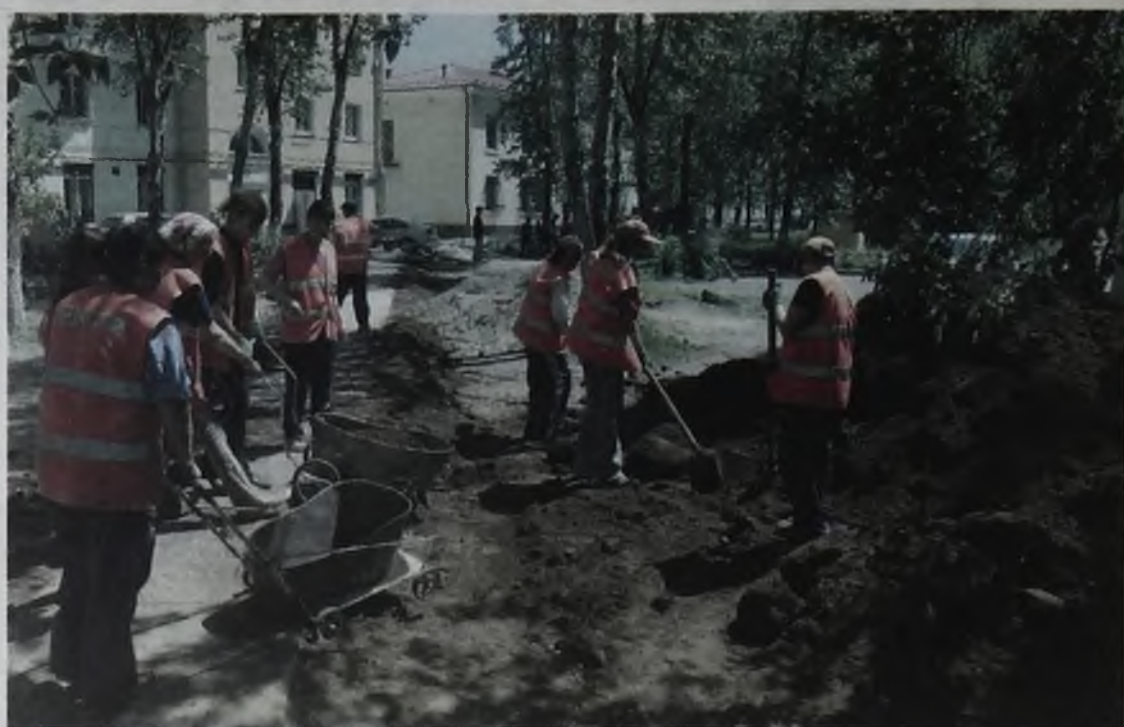
Совместная работа центра и жилищных компаний приносит положительные результаты

Удалось остановить незаконный вывоз гравия с дамбы. В среду мы только обратились с заявлением в соответствующие