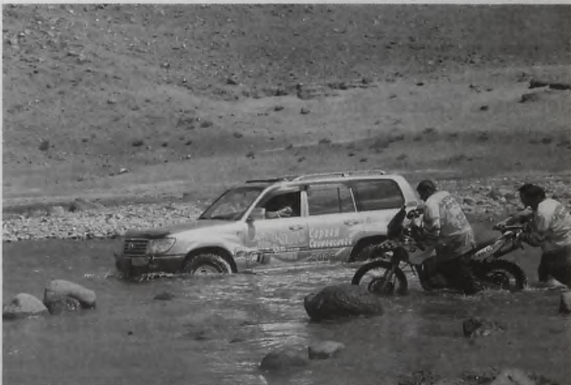
Монголия покоряется сильным