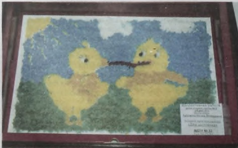
Работа ребят и воспитателей детского клуба «Агатушка»