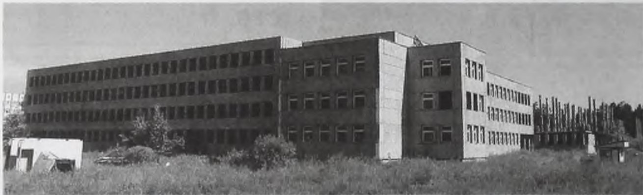
Администрация города делает все, чтобы сохранить финансирование из областного бюджета на строительство важных социальных объектов

– Большинство депутатов Законодательного собрания области представляют как раз дотационные территории. Безусловно, они единодушно проголосуют «за», и закон пройдет. Но вряд ли вы на следующий год откажетесь от социальной ориентированности бюджета и позволите свернуть социальные программы, которые начали реализовывать в этом году. Как будете находить средства?