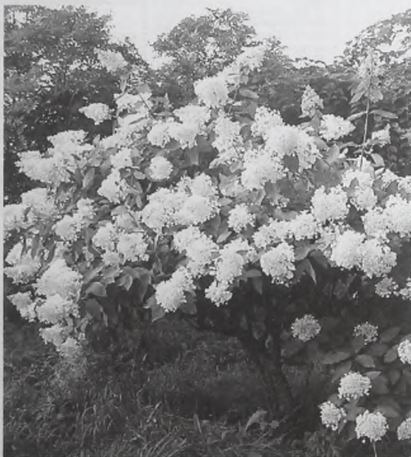
Страницу подготовила Тамара Яковлева

Самое надежное – выкапывать куст, убирать его в подвал и хранить при температуре не выше плюс 5 градусов. При этом ветки укорачиваются на 40-60 сантиметров. Если весной куст проснется раньше срока, нужно выставить его на свет и держать его там до высадки.