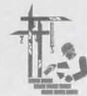
Городской социальный проект «МУНИЦИПАЛЬНОЕ ЖИЛЬЕ»

Построить в Ангарске новый микрорайон доступного и комфортного жилья – с такой инициативой власти нашего города обратились к администрации региона. Идея была одобрена, и уже дано поручение подготовить проект четырехстороннего соглашения между администрацией Иркутской области, администрацией Ангарска, ЗАО «Стройкомплекс» и ОАО «АНХК».