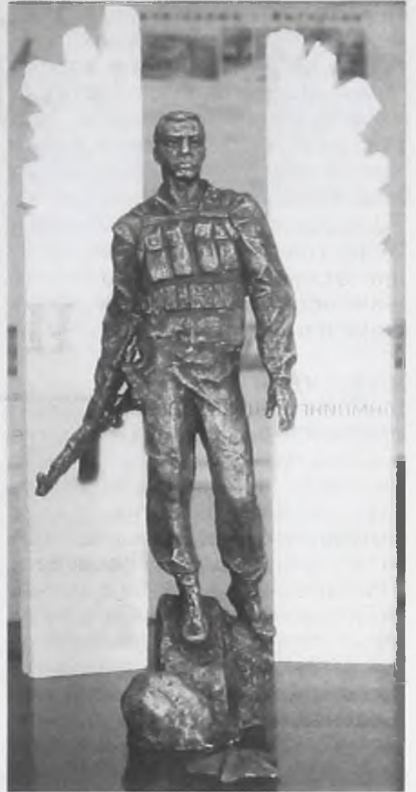
Скульптурный проект будущего памятника

– Единственное, я предлагаю вписать на стелах имена всех погибших воинов, которые призы-