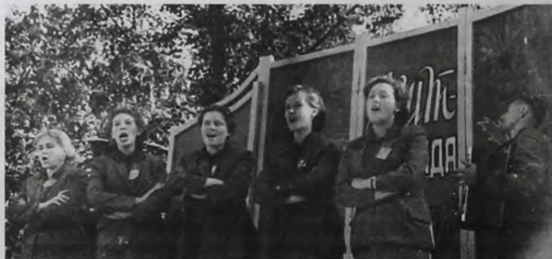
Конец 60-х годов. Фрагмент первого общегородского праздника на стадионе «Ангара»