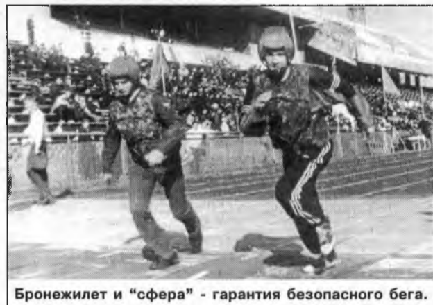
Бронжилет и "сфера" - гарантия безопасного бега.

шей оскомину, и, порядком поднадоевшей всем, заорганизованности. Официальной части - минимум, спорту, веселью и рекордам - все остальное время. Радости ребяташкам не было предела - наддували шарики, устроили конкурс, доставили удовольствие. Так же, как и взрослым. Самыми яркими болельщиками в комбинированной эстафете, в программу которой входили разнообразные этапы - от бега в бронжилете и "сфере", до переноса раненого и двухсотметрового рывка в общевоинском