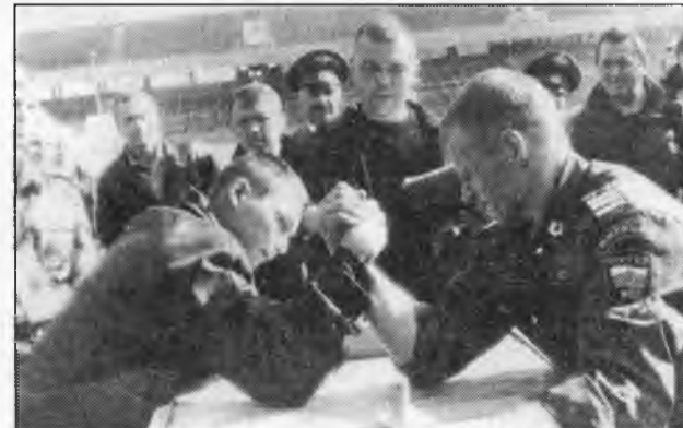
ОМ-2 играет в "армрестлинг". В свободное от работы время.