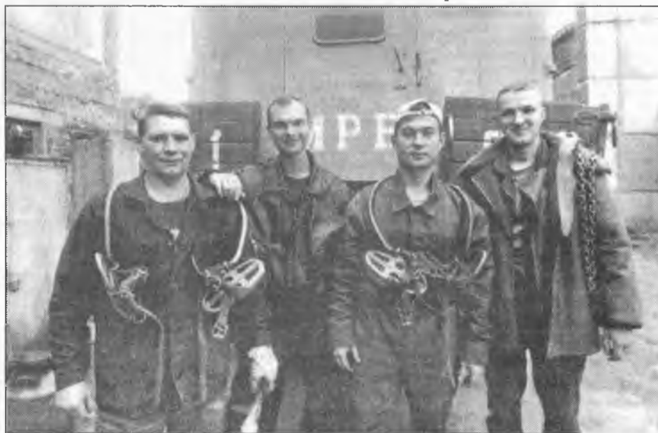
Готовится к выезду бригада участка сетей и подстанций. На шестикиловольтной линии.