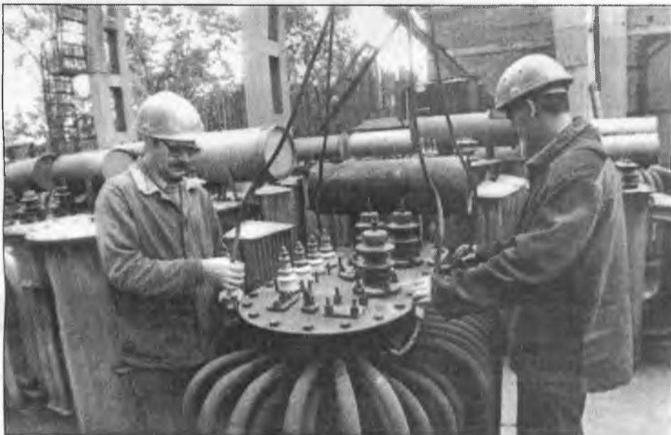
Эти шестикиловольтные трансформаторы привезены для текущего ремонта. Таких в системе электроснабжения СПАО “АУС” более двухсот штук.