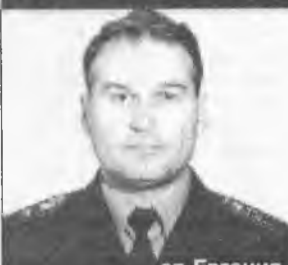
от Евгения КОНСТАНТИНОВА