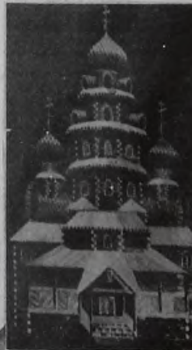
Игрушечка соломенной. Л. Батишук.