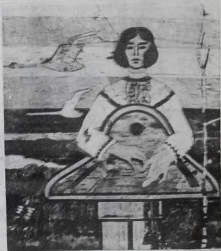
А. Моценюк. «Осенняя песня» (береста).