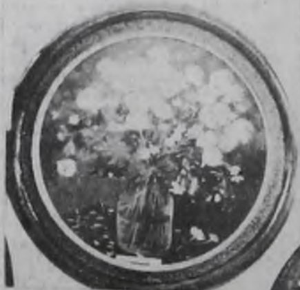
П. Орлов. «Жарук».