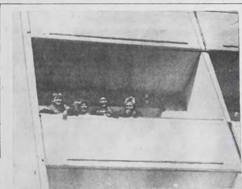
Дом 13 18-го микрорайона.