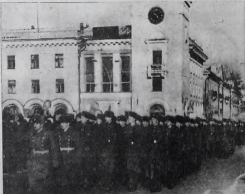
Митинга В. И. Ленину. Митинг завершился торжественным прохождением воинов ЗаБВО и колонны трудящихся.