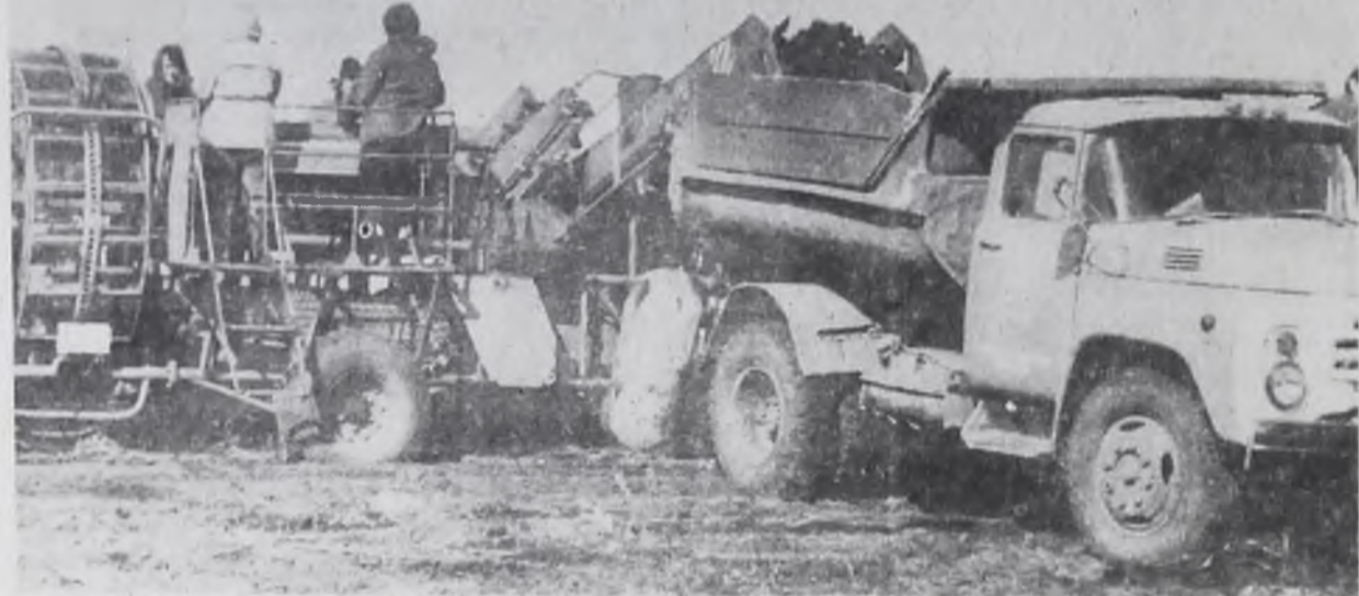
Уборочный конвейер работает безотказно.