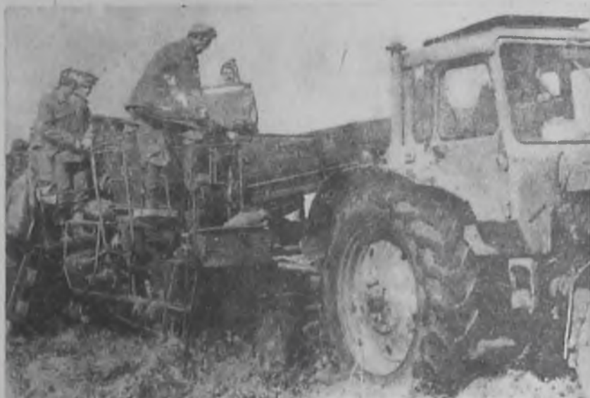
На картофельном поле.