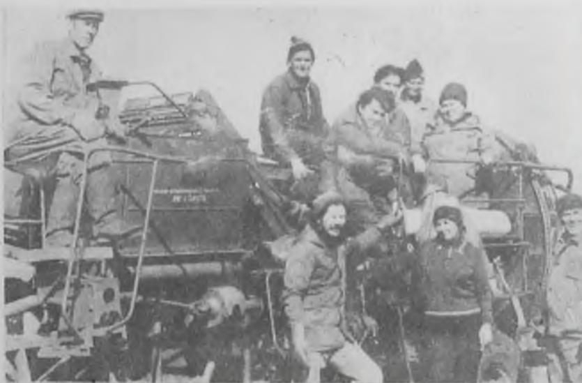
Работники РСЗУ на уборке урожая.