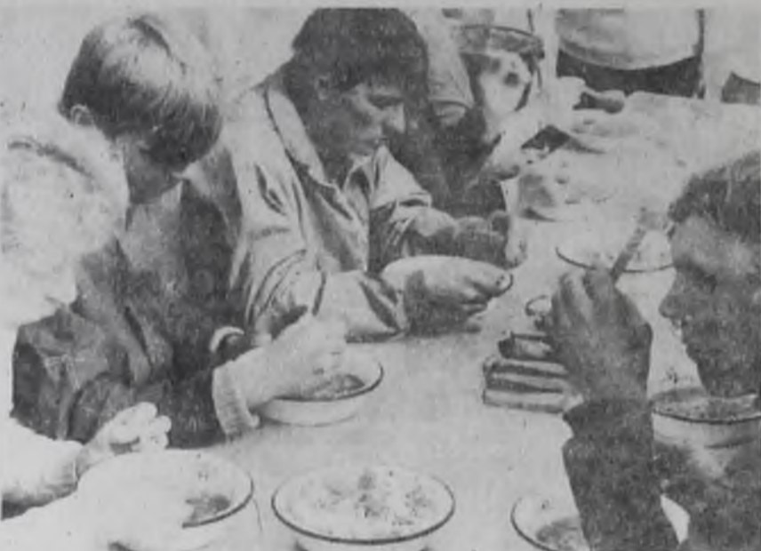
Обед — это вам не общепит.