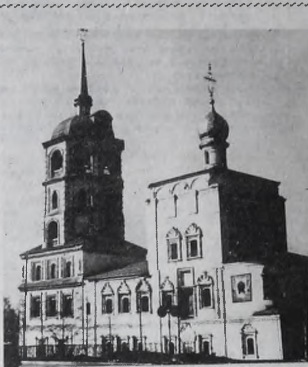
Архитектура старого Иркутска.