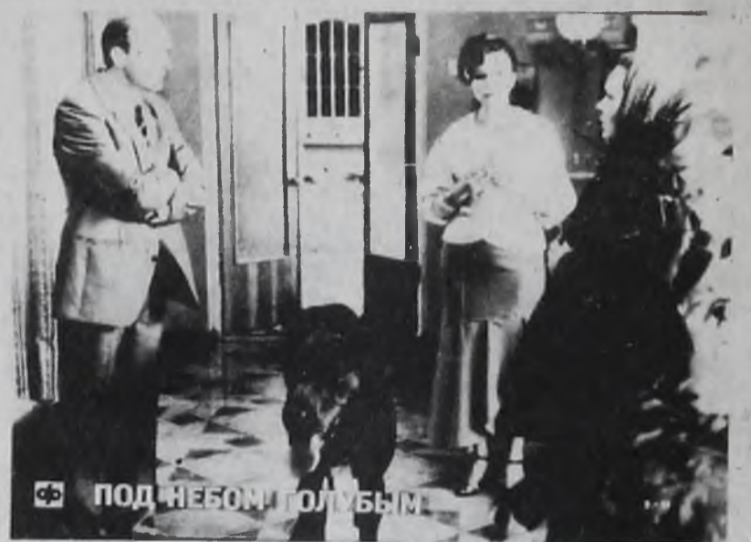
ФФ ПОД НЕБОМ ГОЛУБЫМ

Август сценария фильма «Под небом голубым» Виктор Мережко.