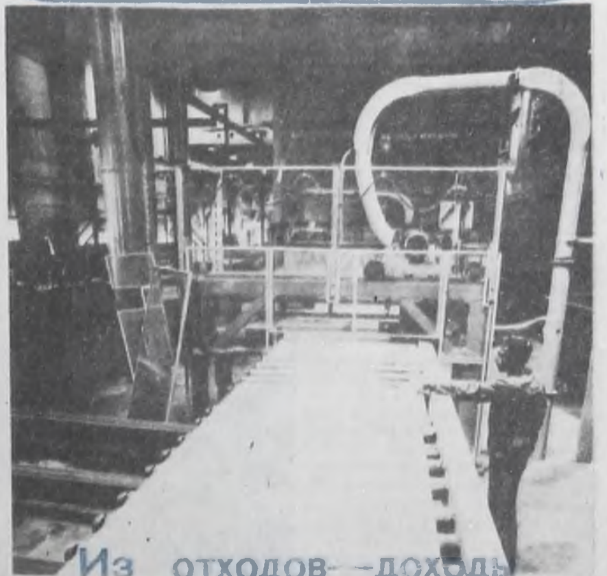
Из отходов — доход

ЛЕНИНГРАД. Новый цех производственного объединения «Светогорск» выпускает волокнистые плиты, применяемые в строительстве. Технология их изготовления совершенно новая. Сырьем служат отходы отстойников станции биологической очистки с 30-процентной добавкой опилок.