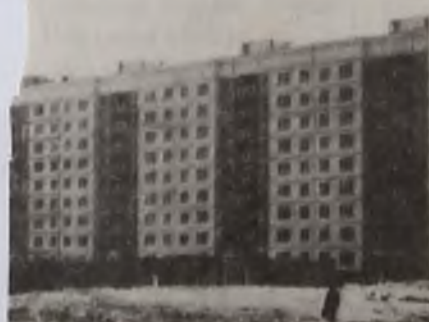
В новом жилом районе.

Единственная надежда на сознательность, ведь среди тех же строителей — немало автолюбителей