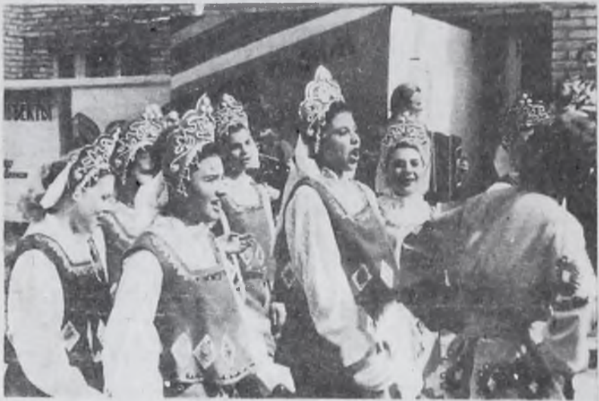
Ансамбль ДК «Строитель» в гостях у военных строителей