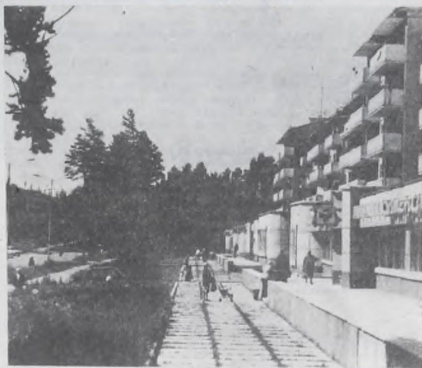
В Юго-Западном районе.