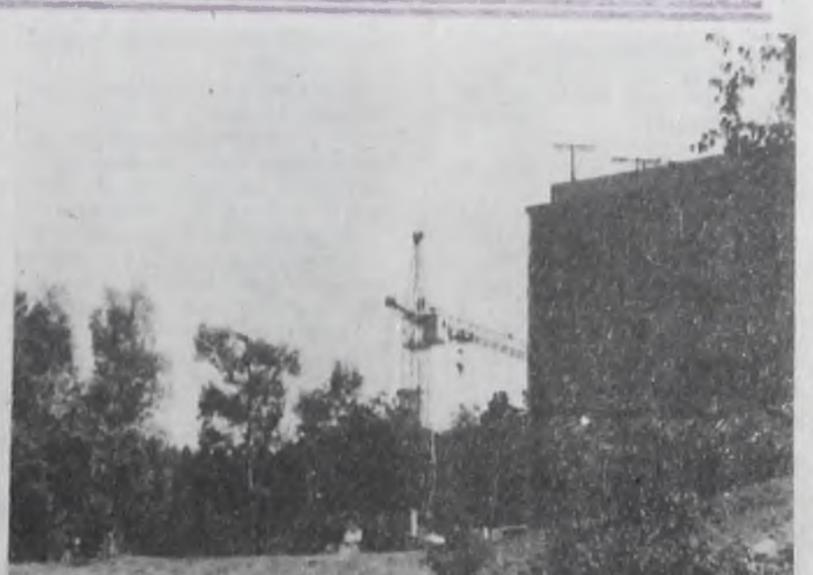
Строительство 33 минерального.