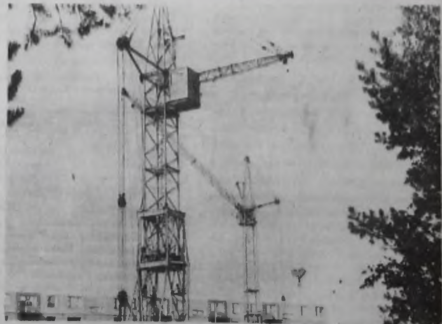
На стройплощадке 33 микрорайона.