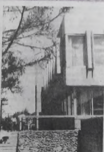
Магазин в с. Любовинская.