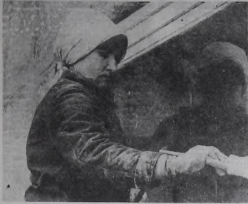
На столовой АЭМЗ продолжают отделочные работы, которые ведут бригады специализированного участка СМУ-6.