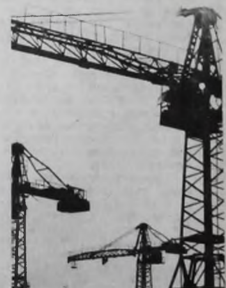
Ритмы стройки