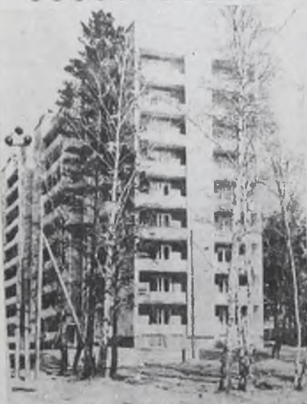
Сибирский город — сибир- ские дома.

И в заключение добавляет: «А где фотографии о бесхо- зяйственности?».