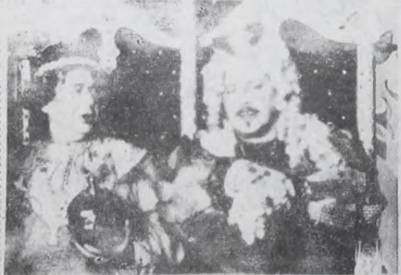
РАЗ ДВА ГОРЕ НЕ БЕДА

Царь встречает храброго солдата щедрыми наградами, в числе которых — его собственная дочь, принцесса Мария-Луиза. Но у Ивана уже есть невеста — Маруся, и потому он наотрез отказывается от предложенной чести. Царь обиделся и отправил солдата в изгнание.