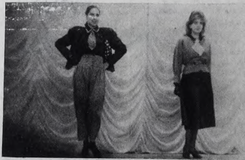
Модели весенне-летнего сезона экспериментальной мастерской Ангарской швейной фабрики индпошива.