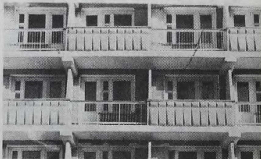
Спальный корпус профилактория строителей.

В. ЛУКОВНИКОВ, директор бассейна СК «Сибиряк».