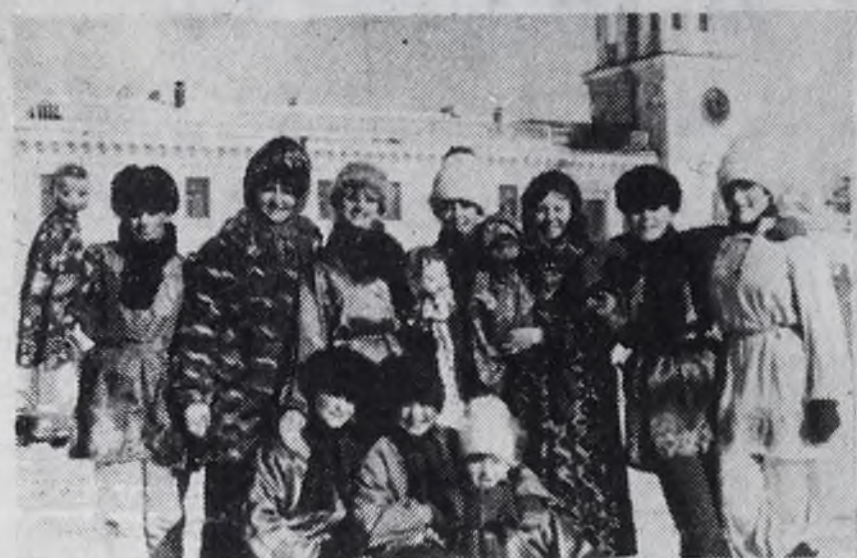
Участники праздника — коллектив кукольного театра ДК «Строитель».