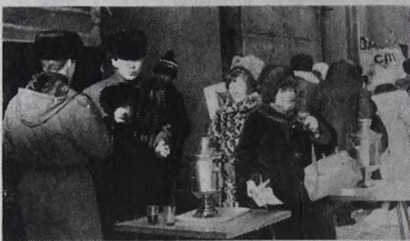
От пронизывающего ветра помогает только стакан горячего ароматного чая.