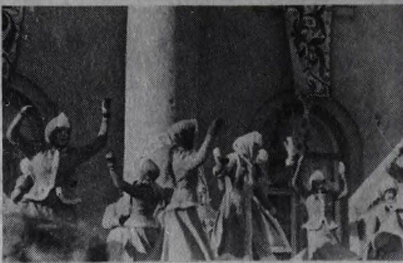
На сцене — ансамбль танца ДК «Строитель».