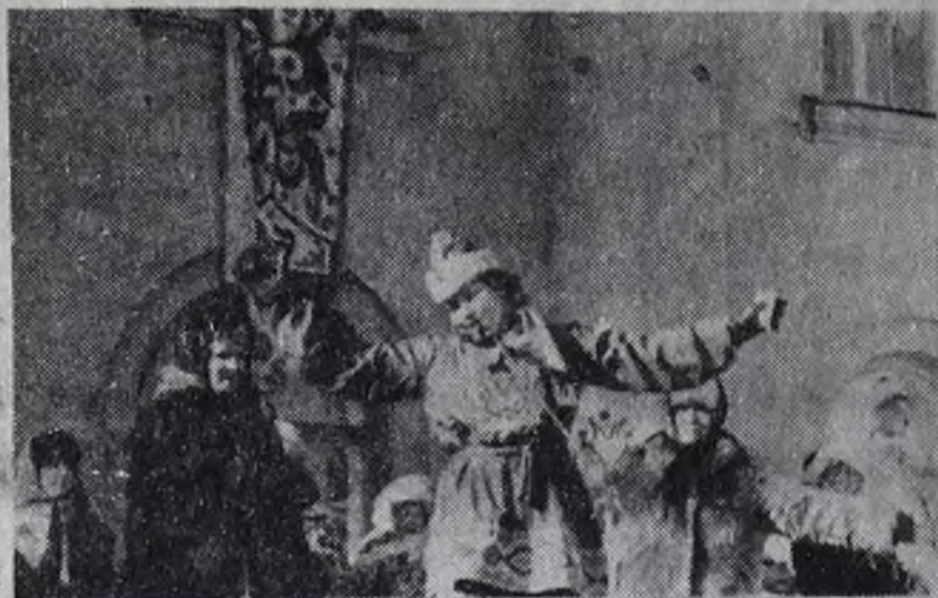
Выступают самодеятельные артисты ДК «Строитель».