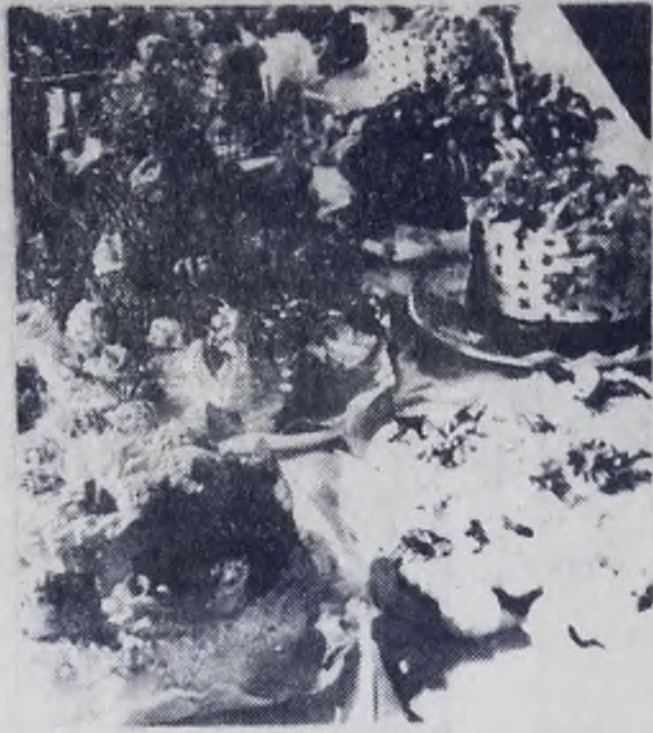
Кондитерские изделия, представленные на аукцион.