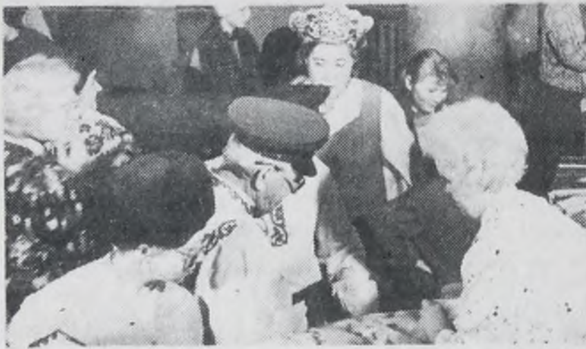
Во время комиссионной торговли.