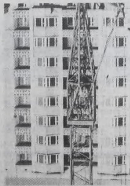
Новая девятиэтажка 10-го микрорайона.