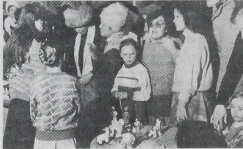
Свои изделия предлагает студия прикладного искусства «Радуга».