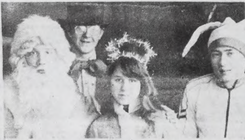
На снимке: участники новогоднего представления — члены театра-студии «Росток» Дома культуры «Строитель» (режиссер Александр Анатольевич Говорин).

По традиции до 13 января — до «старого нового года» — не угасает новогодняя тема.