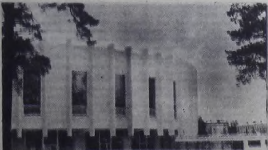
Пристройка к ДК «Современник».