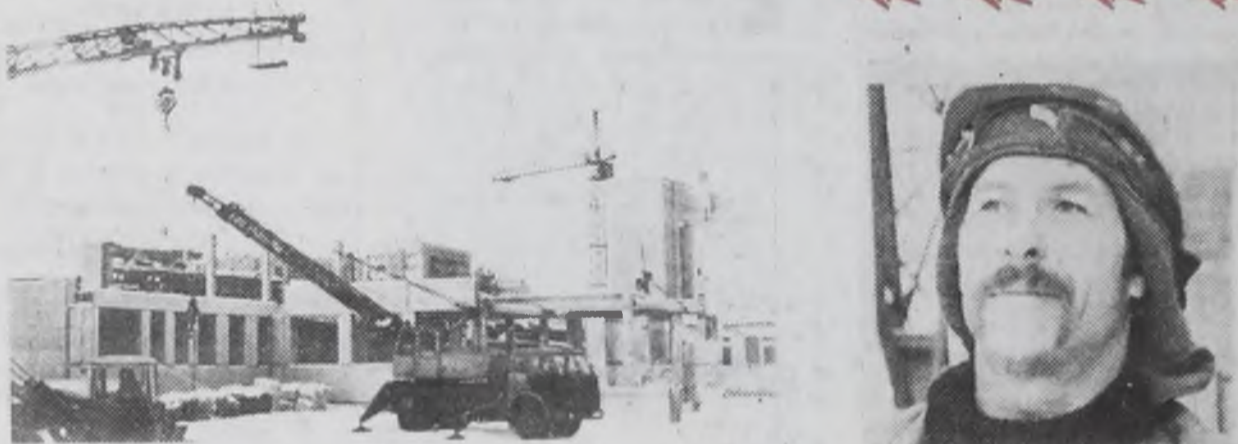
Роддом. Стройка продолжается.

С. РАЗУМОВСКАЯ, референт-организатор общества «Знание».