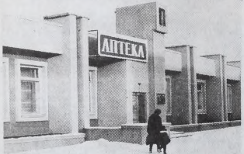
Новостройки 12а микрорайона.