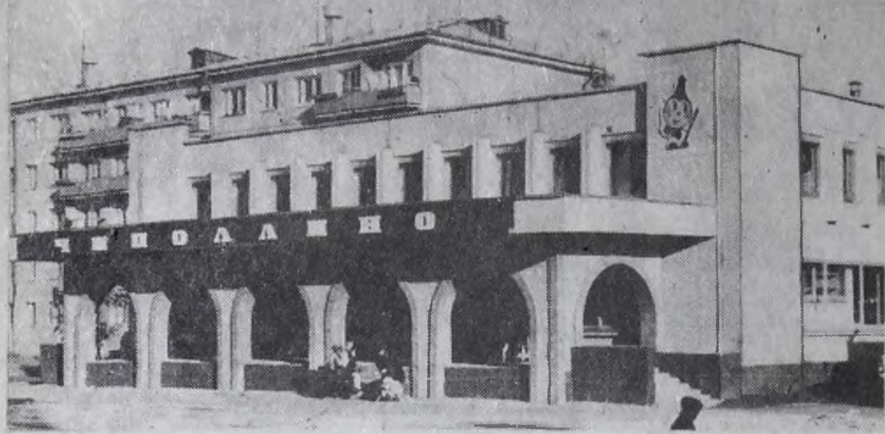
Новый магазин открылся в ба микрорайоне, в нем два торговых зала. В этом нет ничего особенного, если бы не необычное соседство товаров, представленных здесь. На первом этаже покупателям предлагаются овощи, фрукты, а на втором — канцелярские принадлежности, товары для школьников. На снимке: здание нового магазина.