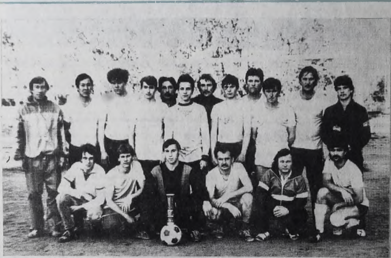
Команда УАТа — победительница розыгрыша кубка на приз нашей газеты.

В. УСТИНОВ, врач-методист центра охраны здоровья.