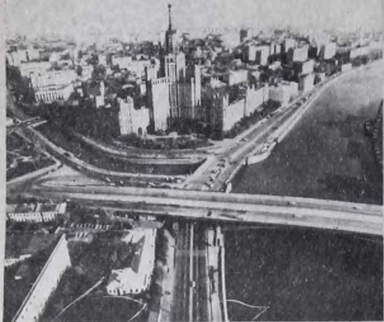
Москва. Котельническая набережная.