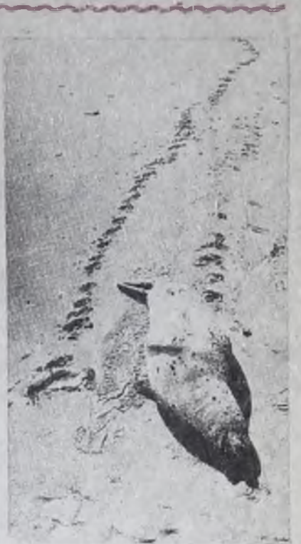
Продолжается гибель тюленей (на снимке).

По мнению ученых, смерть наступает в результате неизвестного пока заболевания, вызванного чрезмерным загрязнением экватории. Английская телепрограмма Айти-ви бьет тревогу: то, что сейчас происходит с Северным морем, очень скоро может перекинуться на другие акватории планеты.