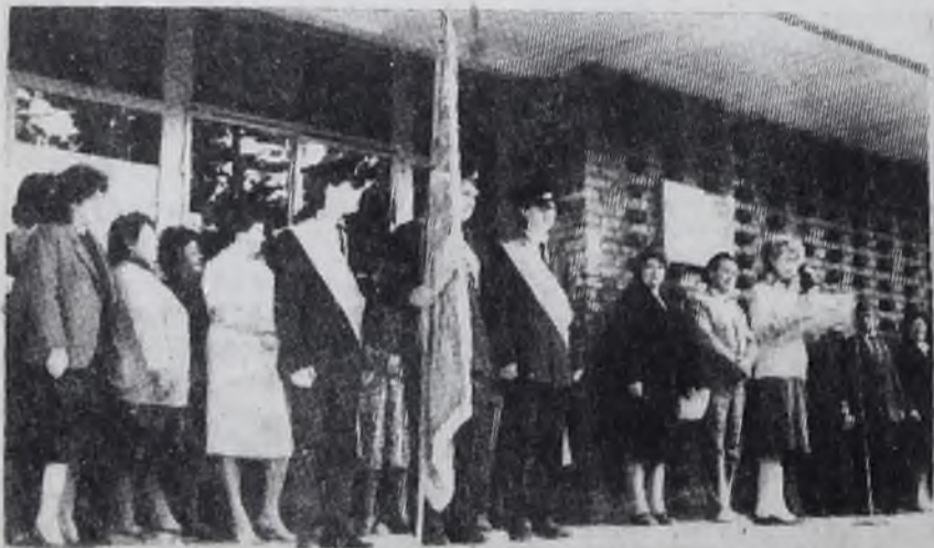
День знаний по традиции начинался в училище с торжественной линейки.

Л. ГОВОРИНА, зав. кабинетом политпросвещения парткома АУС.