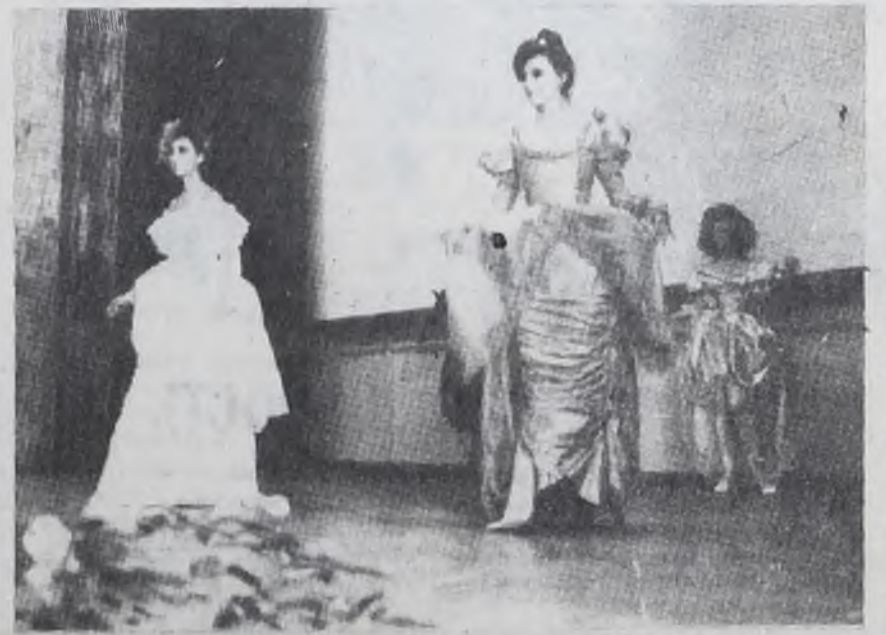
В ДК «Энергетик» ребята посмотрели в этот день спектакль театра мод «В человеке должно быть все прекрасно...»