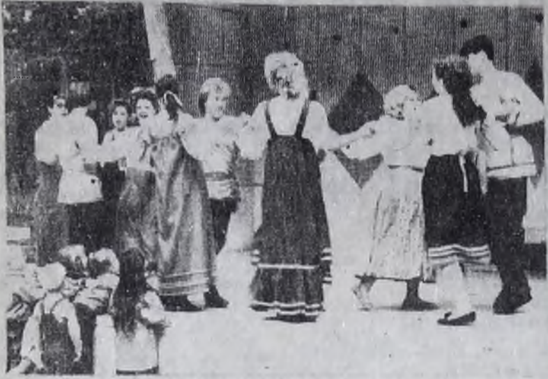
Выступает фольклорный ансамбль.