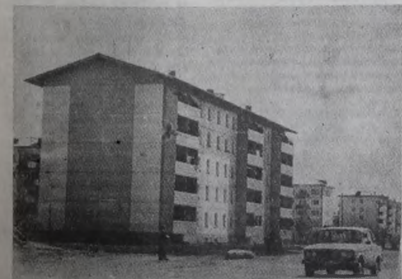
Рабочий поселок Белореченский строят усольские строители

Давайте рассуждать так: при шести с лишним миллионах рублей всех объемов, которые строители выполняют на предприятиях агрокомплекса, справедливо было бы ожидать ответное изобилие сельхозпродукции. Мы бы в таком случае с избытком были обеспечены и мясом, и молоком и т. д. Но ведь каждое сельхозпредприятие — хозяйство плановое и прежде всего оно обязано поставлять производимую продукцию государству. Так что сверхплановые поступле-